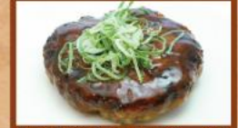
照り焼きハンバーグ