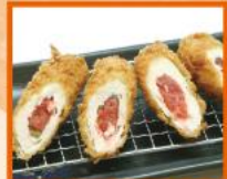
鶏の梅しそ巻きかつ