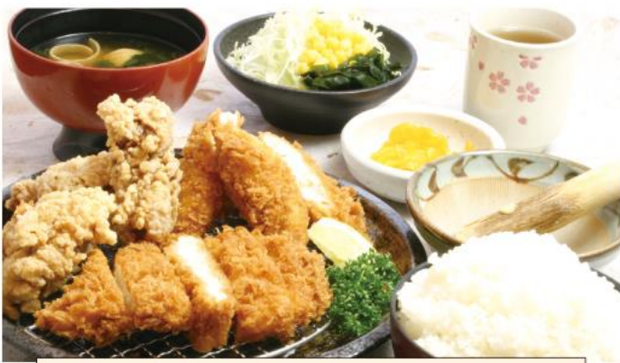
チキンちきんChicken 1,300円(税込)