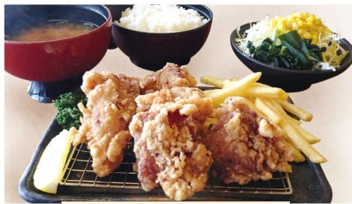
から揚げ膳 1,150円(税込)