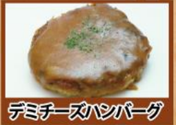
デミチーズハンバーグ