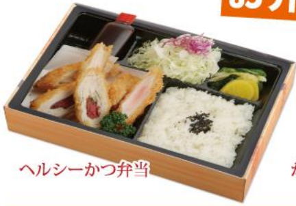
ヘルシーかつ弁当