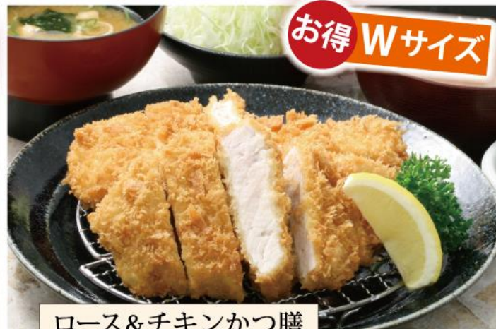
ロース&チキンかつ膳 特別価格 1,500円(税込)