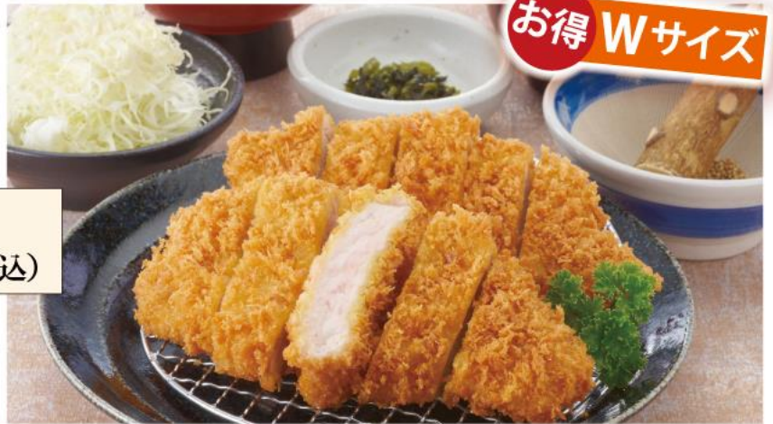
Wロースかつ膳 特別価格 1,600円(税込)