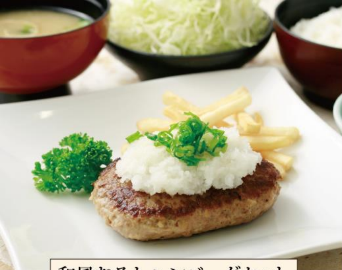
和風おろしハンバーグセット 1,250円(税込)