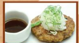
和風おろしハンバーグ