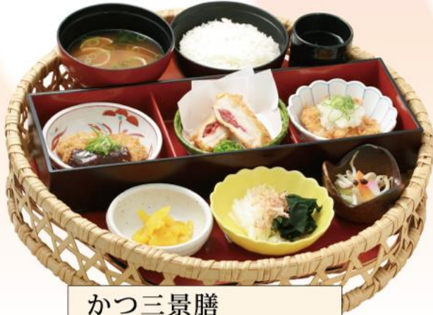
かつ三景膳 1,430円(税込)

味噌ヒレかつ 鶏の梅しそ巻きかつ おろしチキンかつ ※小鉢は日により変わります。