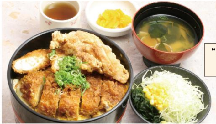
“これでもか”かつ丼 1,300円(税込)