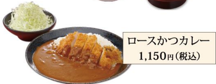
ローズかつカレー 1,150円(税込)