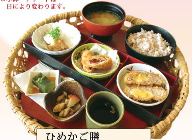
ひめかご膳 1,400円(税込)

みぞれ唐揚げ 鶏の梅しそ巻きかつ チーズメンチかつ ※小鉢・デザートは 日により変わります。