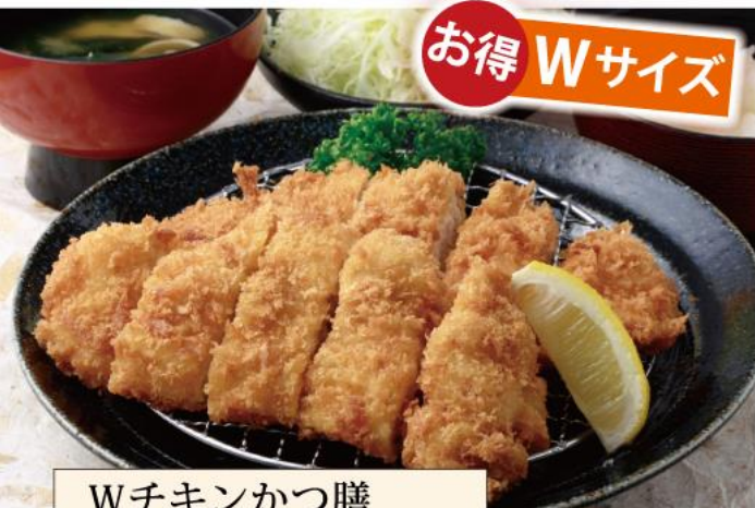
Wチキンかつ膳 特別価格 1,400円(税込)