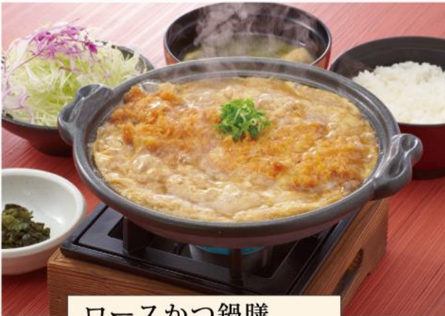
ローズかつ鍋膳 1,400円(税込)