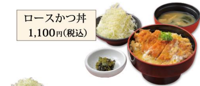
ローズかつ丼 1,100円(税込)