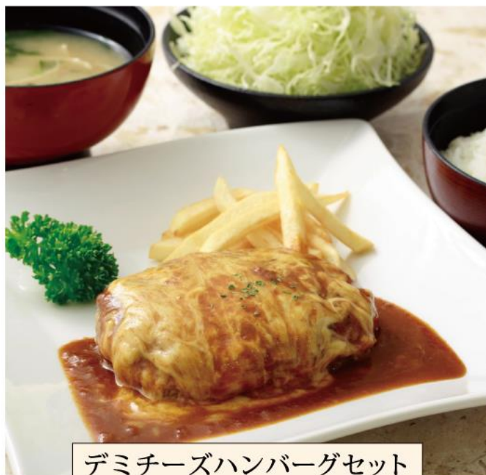
デミチーズハンバーグセット 1,250円(税込)