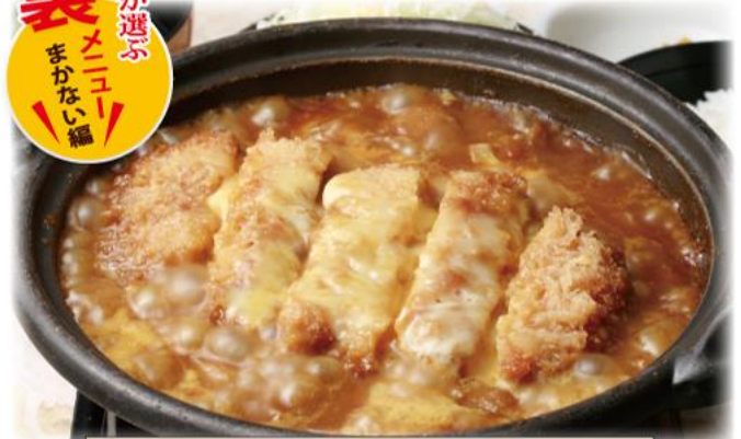
kinoyaローズかつカレー鍋膳 1,400円(税込)