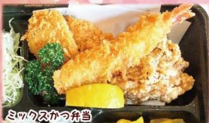
ミックスかつ弁当