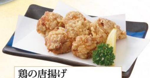
鶏の唐揚げ 【5個】600円(10%税込) 【3個】400円(10%税込)