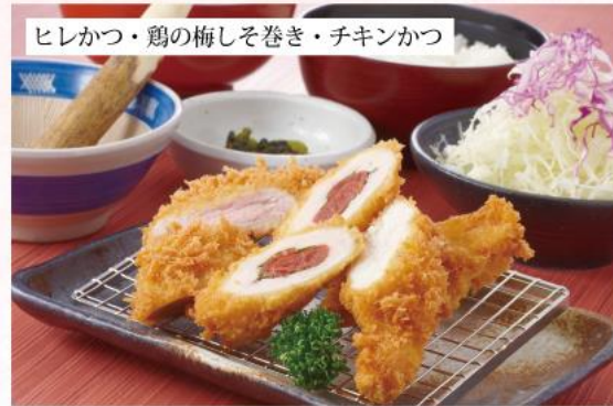
ヒレかつ・鶏の梅しそ巻き・チキンかつ