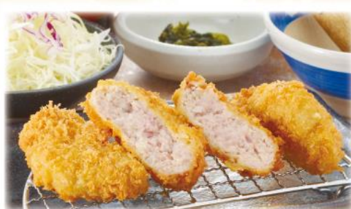
手作り メンチかつ ランチ