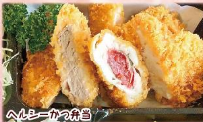
ヘルシーかつ弁当