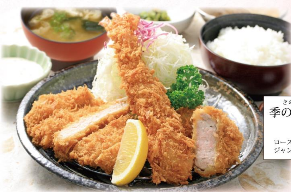
きのやごぜん 季の屋御膳 1,720円(10%税込) ロースかつ・ヒレかつ ジャンボ海老フライ