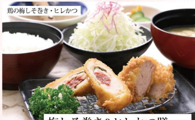
鶏の梅しそ巻き・ヒレかつ