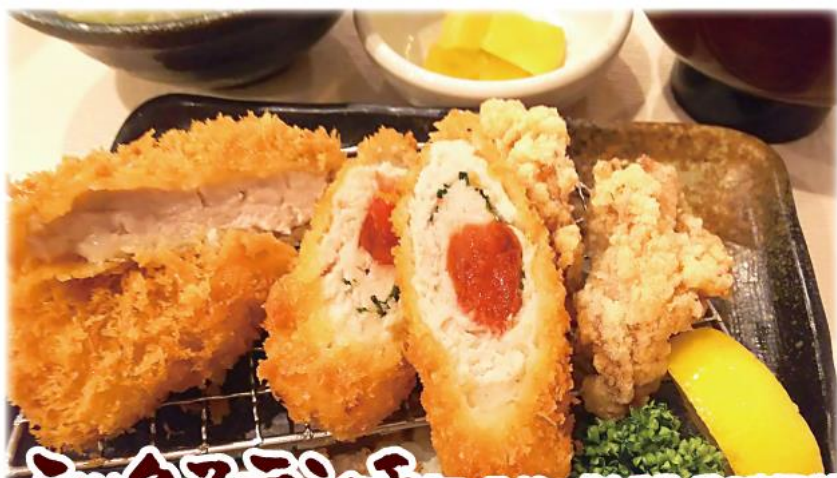
ミックスマランチ【ロース40g・梅しそ巻・鶏の唐揚げ】