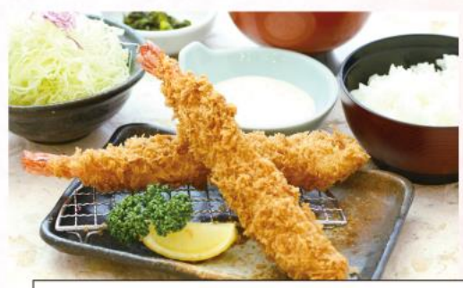
ジャンボ海老フライ膳 1,580円(10%税込)