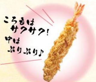
1尾 小えびフライ 150円(10%税込)