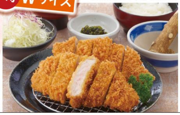
Wロースかつ膳 1,630円(10%税込)