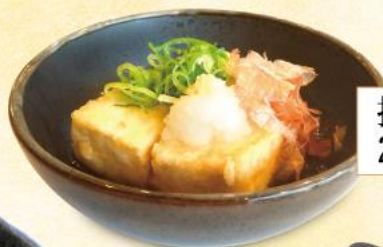
揚げ出し豆腐 290円(10%税込)