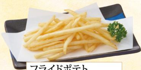
フライドポテト 270円(10%税込)