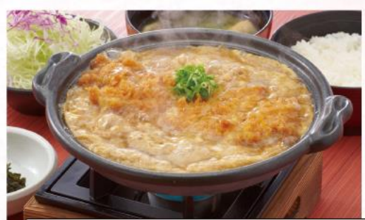
ロースかつ鍋膳 1,320円(10%税込)