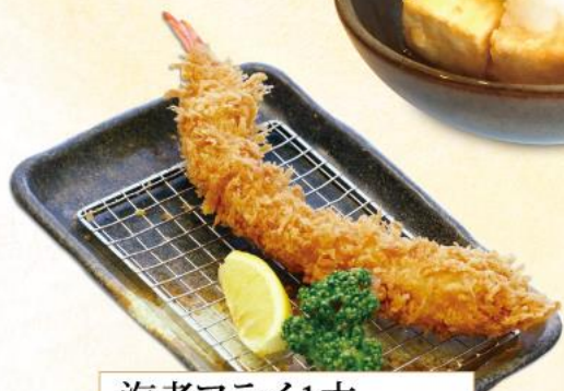
海老フライ1本 480円(10%税込)