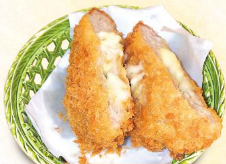
チーズメンチ 170円(10%税込)