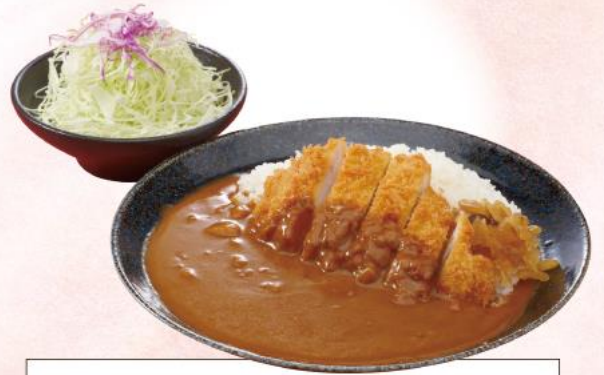
かつカレー 1,170円(10%税込)