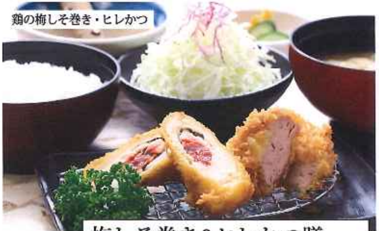
梅しそ巻き&ヒレかつ膳 950円(10%税込)