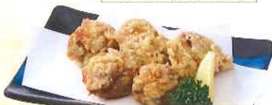
鶏の唐揚げ 【5個】600円(10%税込) 【3個】400円(10%税込)