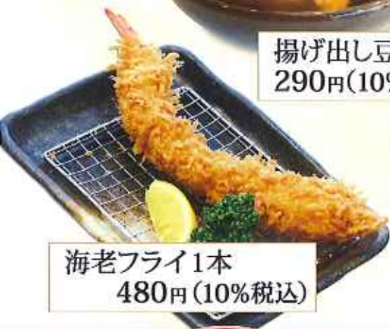
海老フライ1本 480円(10%税込)