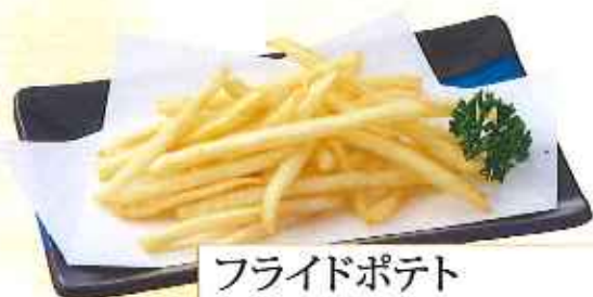
フライドポテト 250円(10%税込)