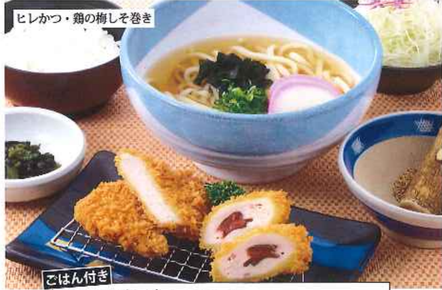
ごはん付き TONうどんセット 1,200円(10%税込)