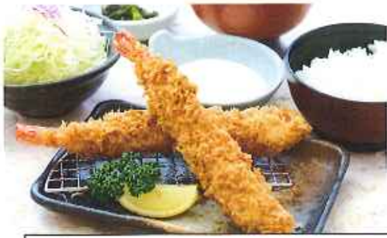
ジャンボ海老フライ膳 1,580円(10%税込)