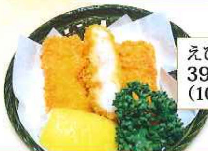
えびかつ 390円 (10%税込)