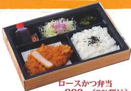
ロースかつ弁当 800円(8%税込)