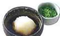
おろしポン酢 110円(10%税込)