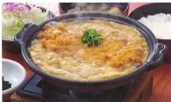
ロースかつ鍋膳 1,250円(10%税込)