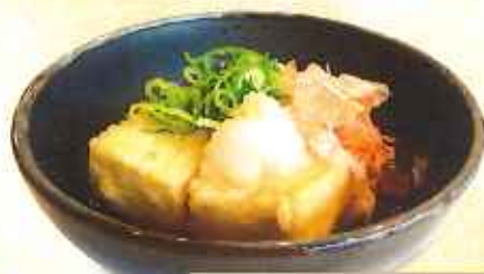
揚げ出し豆腐 290円(10%税込)