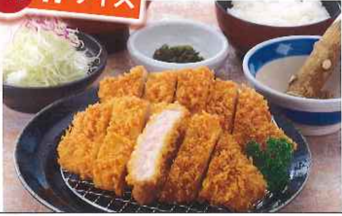
Wロースかつ膳 1,580円(10%税込)