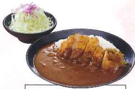
かつカレー 1,080円(10%税込)