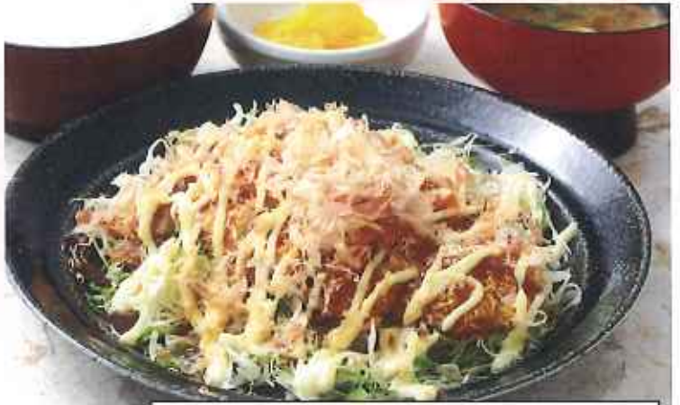
お好みチキンかつ膳 1,170円(10%税込)