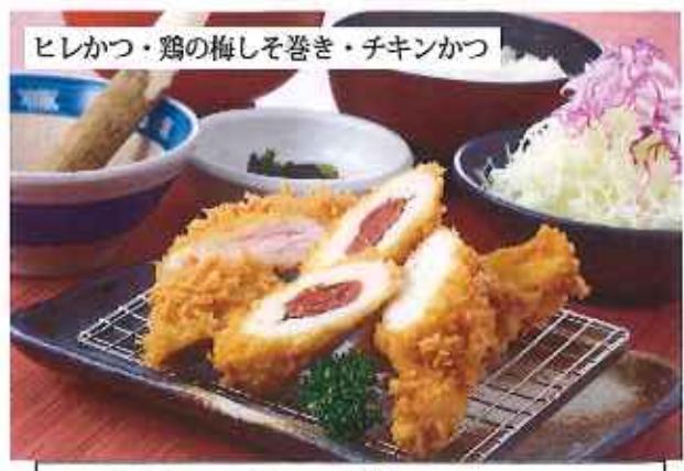
ヘルシーかつ膳 1,120円(10%税込)