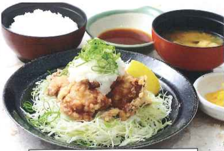
みぞれ唐揚げ膳 1,050円(10%税込)