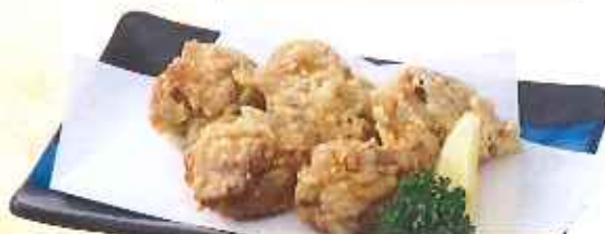
鶏の唐揚げ 【5個】600円(10%税込) 【3個】400円(10%税込)