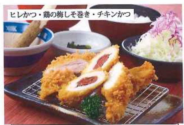
ヒレかつ・鶏の梅しそ巻き・チキンかつ