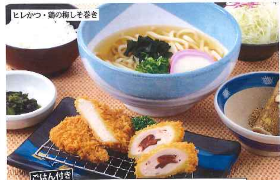
ヒレかつ・鶏の梅しそ巻き