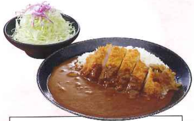
かつカレー 1,080円(10%税込)