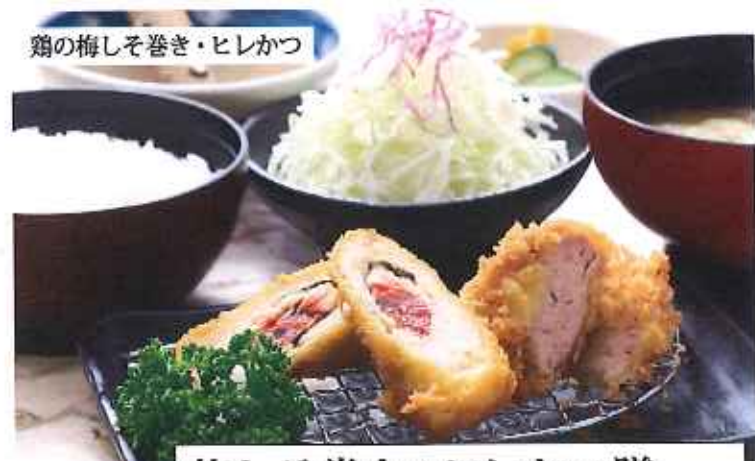
鶏の梅しそ巻き・ヒレかつ