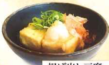
揚げ出し豆腐 290円(10%税込)