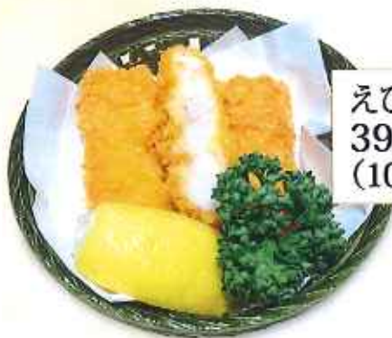
えびかつ 390円 (10%税込)