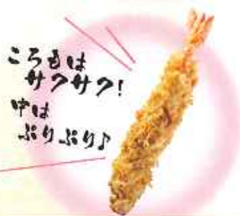
1尾 小えびフライ 120円(10%税込)