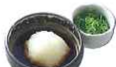
おろしポン酢 110円(10%税込)