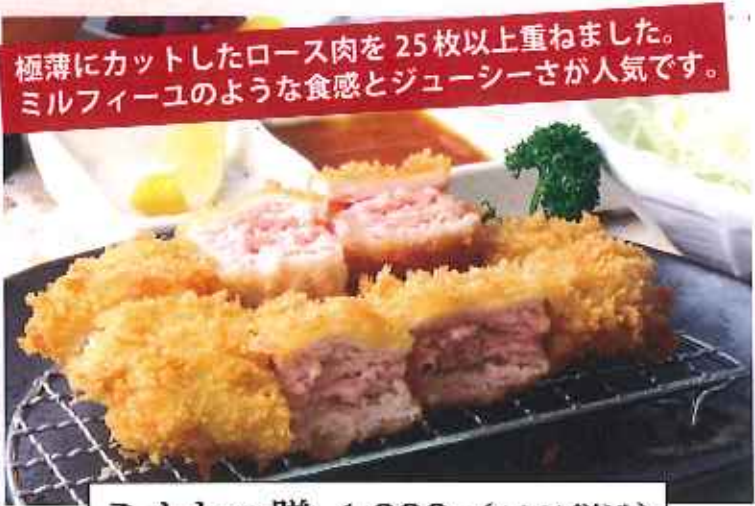
極薄にカットしたロース肉を25枚以上重ねました。 ミルフィーユのような食感とジューシーさが人気です。