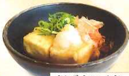
揚げ出し豆腐 290円(10%税込)