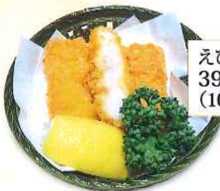
えびかつ 390円 (10%税込)