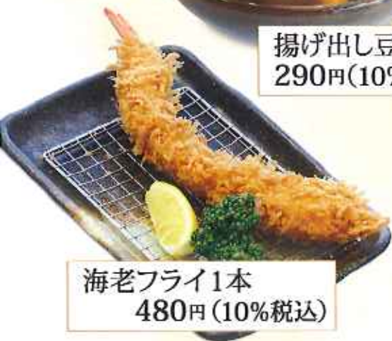
海老フライ1本 480円(10%税込)