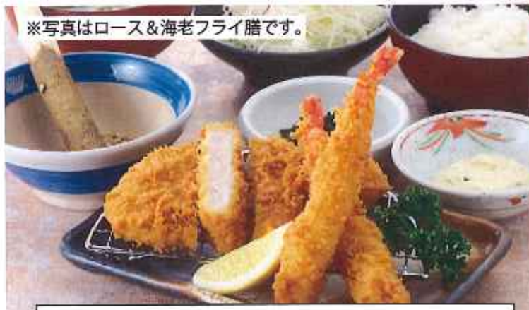
※写真はロース&海老フライ膳です。