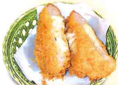
チーズメンチ 150円(10%税込)