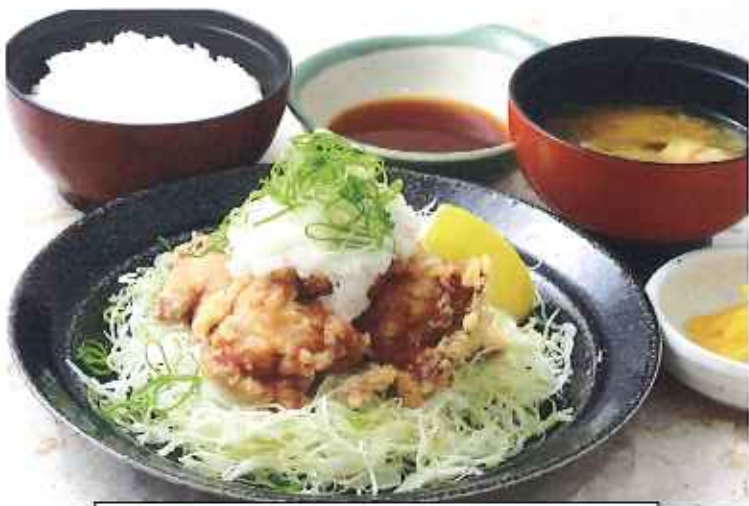
みぞれ唐揚げ膳 1,050円(10%税込)