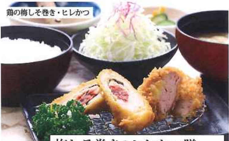
鶏の梅しそ巻き・ヒレかつ