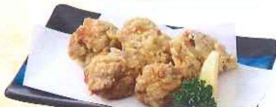
鶏の唐揚げ 【5個】600円(10%税込) 【3個】400円(10%税込)