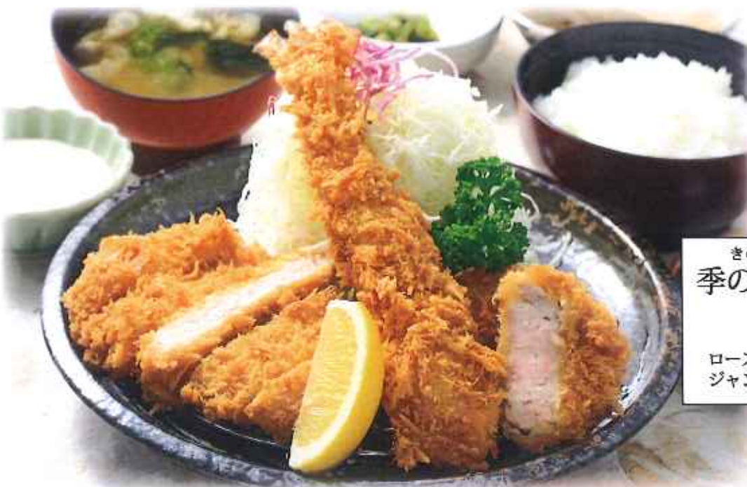
きのよごぜん 季の屋御膳 1,680円(10%税込) ロースかつ・ヒレかつ ジャンボ海老フライ