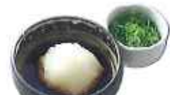
おろしポン酢 110円(10%税込)