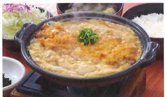
ロースかつ鍋膳 1,250円(10%税込)