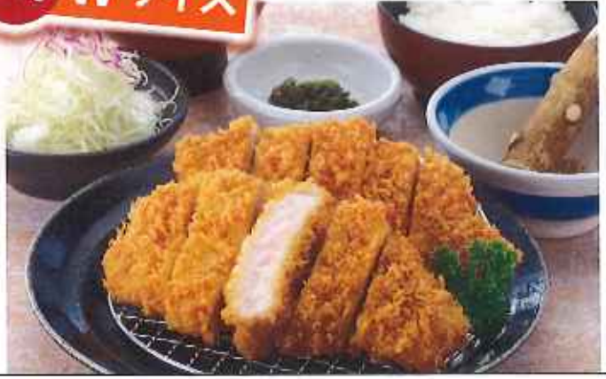
Wロースかつ膳 1,580円(10%税込)