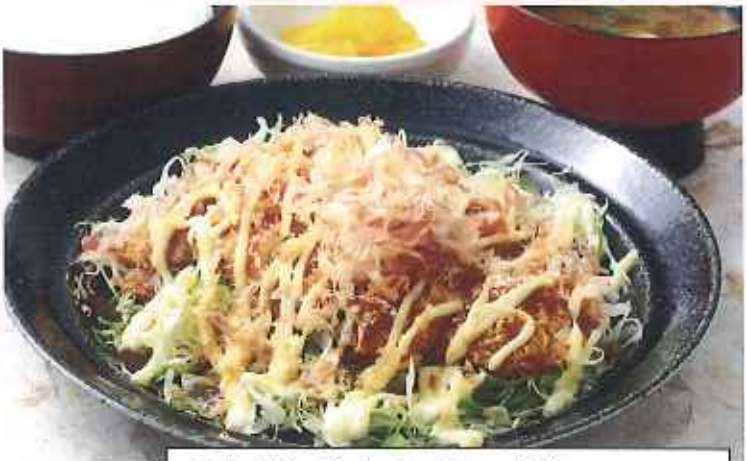
お好みチキンかつ膳 1,170円(10%税込)