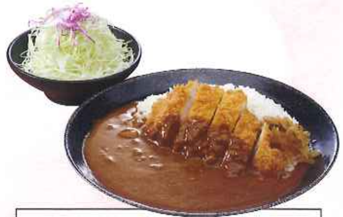
かつカレー 1,080円(10%税込)