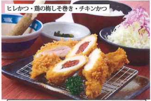
ヒレかつ・鶏の梅しそ巻き・チキンかつ