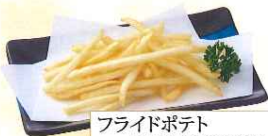
フライドポテト 250円(10%税込)