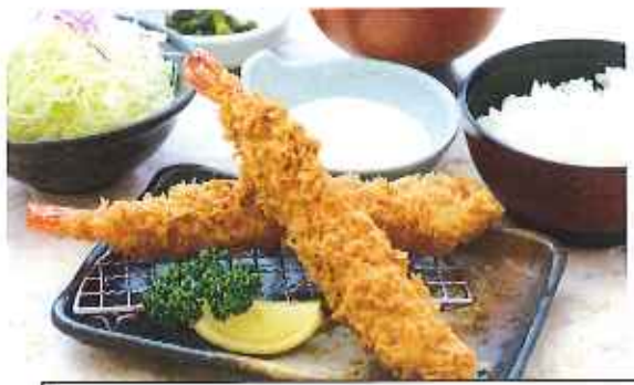
ジャンボ海老フライ膳 1,580円(10%税込)