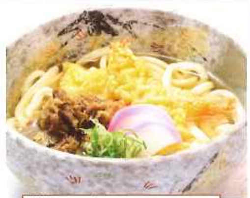
贅沢うどんーぜいたくうどんー 【単品】 890円(税込) 【丼セット】 1,250円(税込)