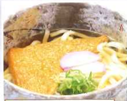
きつねうどん 【単品】 630円(税込) 【丼セット】 990円(税込)