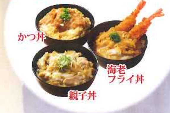
かつ丼 海老フライ丼 親子丼