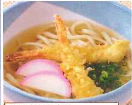
天ぷらうどん 【単品】 740円(税込) 【丼セット】 1,100円(税込)