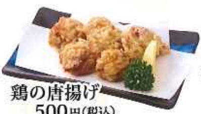
鶏の唐揚げ 500円(税込)