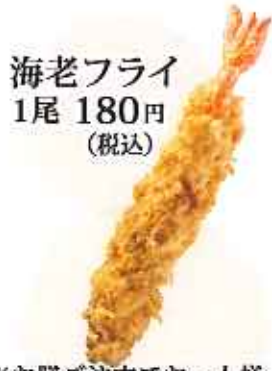
海老フライ 1尾 180円(税込)