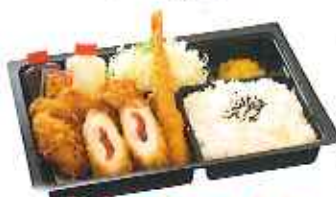
ミックスかつ弁当