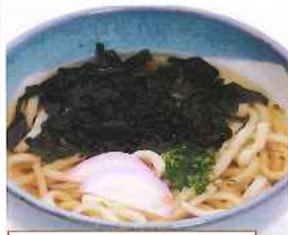
わかめうどん 【単品】 630円(税込) 【丼セット】 990円(税込)