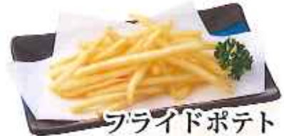
フライドポテト 250円(税込)