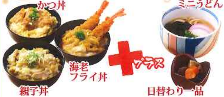
かつ丼 海老フライ丼 親子丼 ミニうどん 日替わり一品