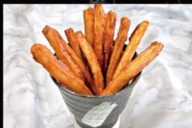
ごぼうスティック ¥690