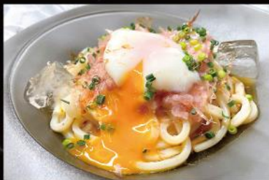
ねぎトロ温玉冷やしうどん ¥1,220