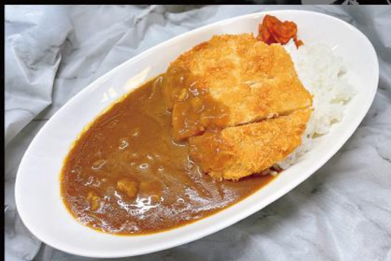
三元豚カツカレー ¥1,290