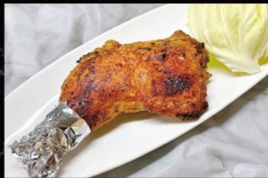
丸亀名物骨付き鳥 ¥1,530