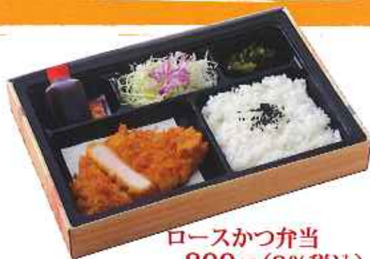
ロースかつ弁当 800円(8%税込)