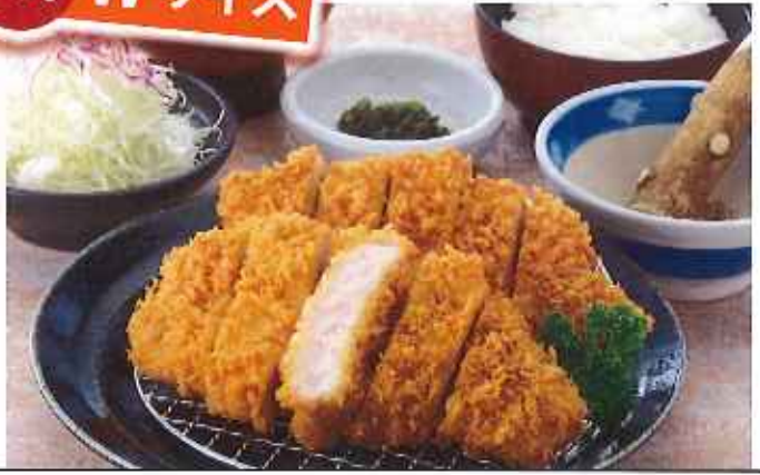
Wロースかつ膳 1,580円(10%税込)