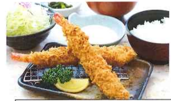
ジャンボ海老フライ膳 1,580円(10%税込)