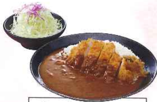
かつカレー 1,080円(10%税込)