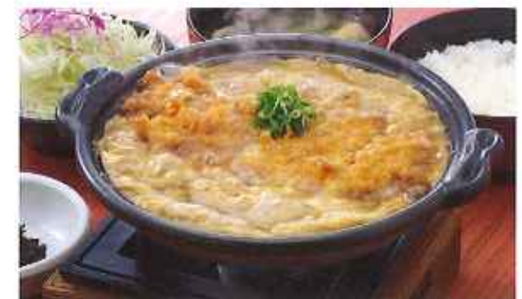
ロースかつ鍋膳 1,250円(10%税込)