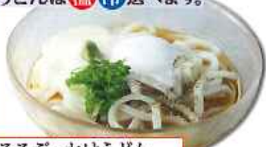
とろろぶっかけうどん