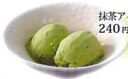
抹茶アイス 240円(税込)