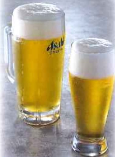
生ビール(中) 540円(税込)