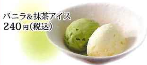
バニラ&抹茶アイス 240円(税込)