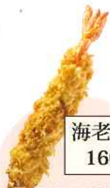
海老フライ【1本】 160円(税込)