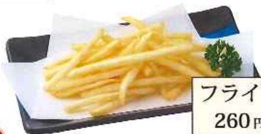
フライドポテト 260円(税込)

※お膳ご注文のお客様は お一人様2本まで 1本 +110円(税込)で 付けられます。