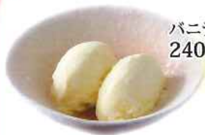
バニラアイス 240円(税込)