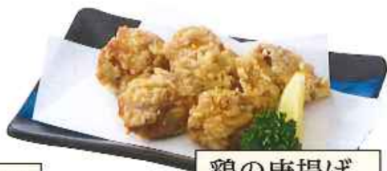
鶏の唐揚げ 460円(税込)