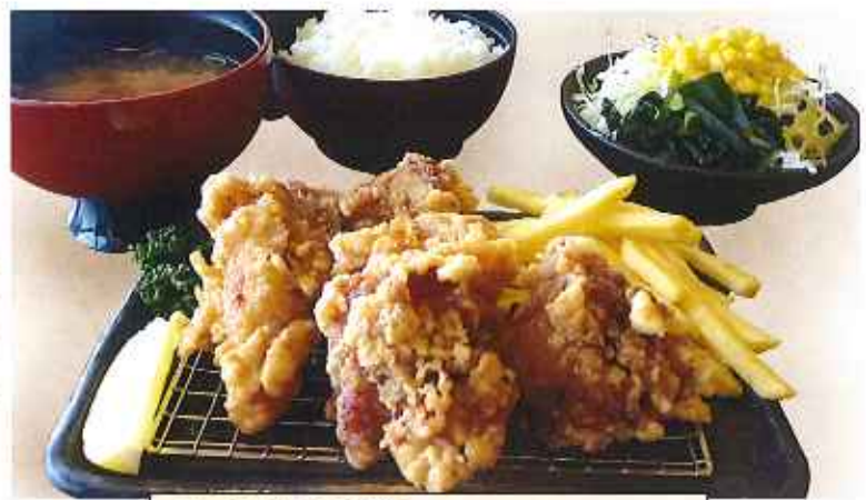
から揚げ膳 1,010円(税込)