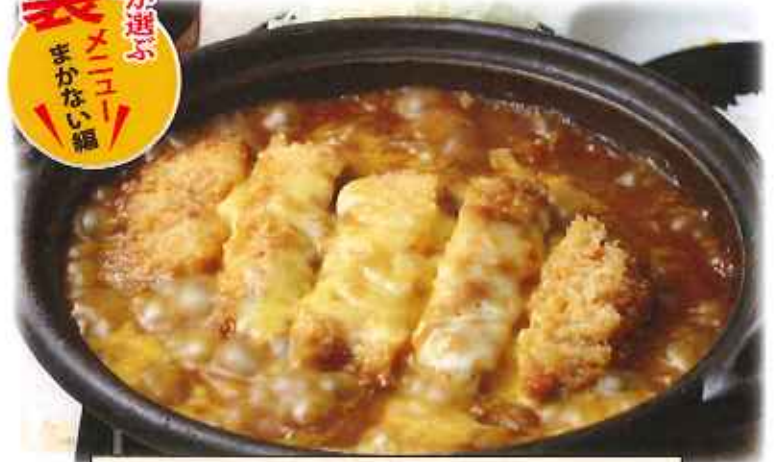
kinoyaローズかつカレー鍋膳