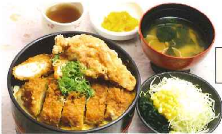
“これでもか”かつ丼 1,150円(税込)