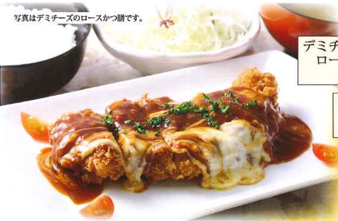
デミチーズの ロースかつ膳 1,280円(税込)