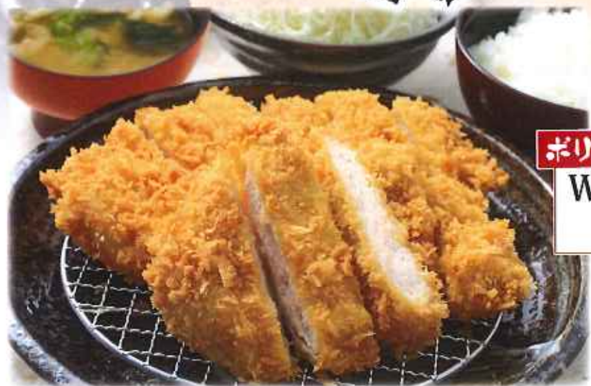
ボリュームたっぷり! Wロースかつ膳 1,460円(税込)