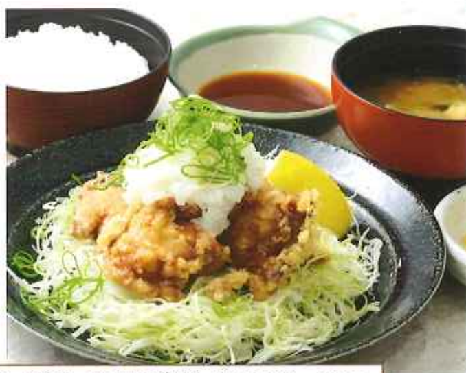
みぞれ唐揚げ膳 1,090円(税込)