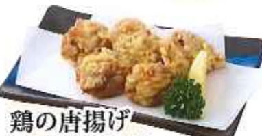
鶏の唐揚げ 470円(税込)