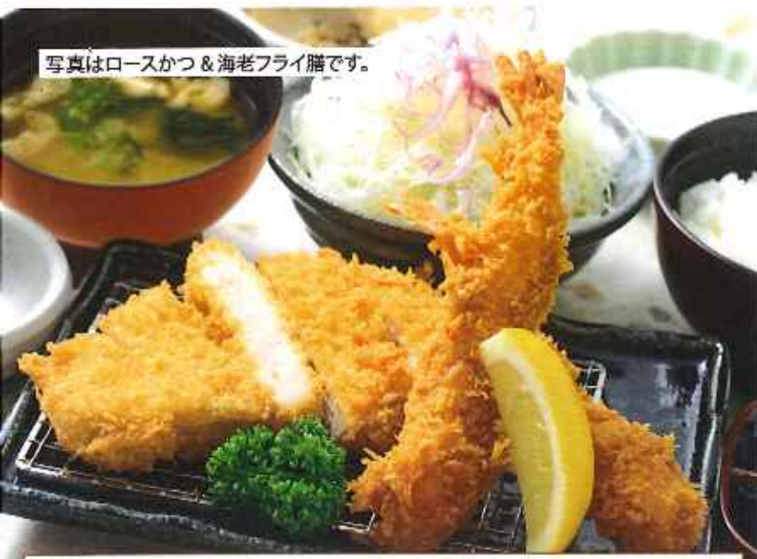
ロースかつ & 海老フライ膳 1,300円(税込)