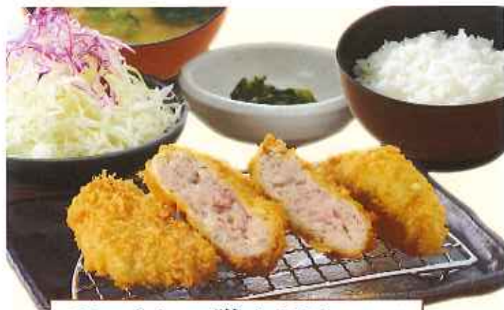
メンチかつ膳 1,090円(税込)