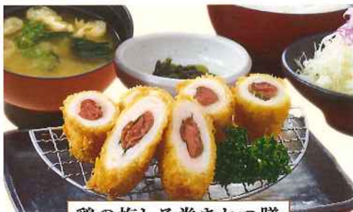
鶏の梅しそ巻きかつ膳 1,180円(税込)