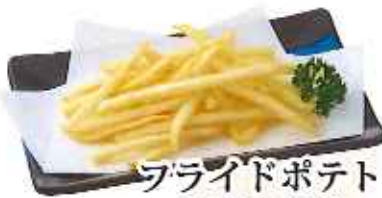
フライドポテト 240円(税込)