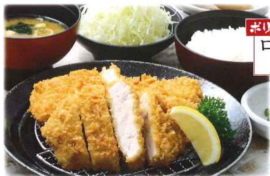
ボリュームたっぷり! ロース&チキンかつ膳 1,270円(税込)