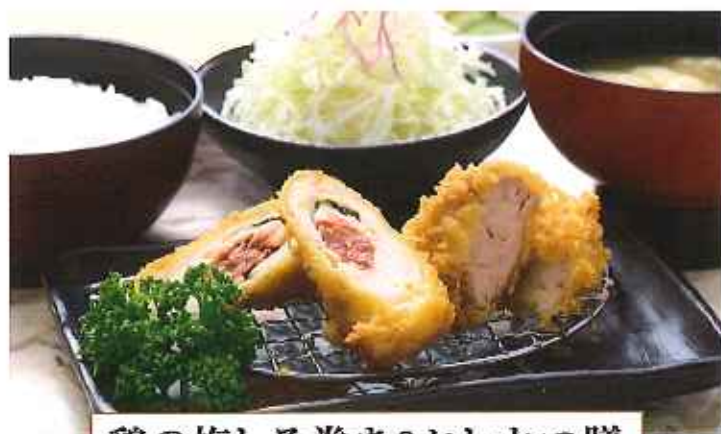
鶏の梅しそ巻き&ヒレかつ膳 1,000円(税込)