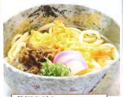
贅沢うどんーぜいたくうどんー