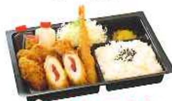
ミックスかつ弁当