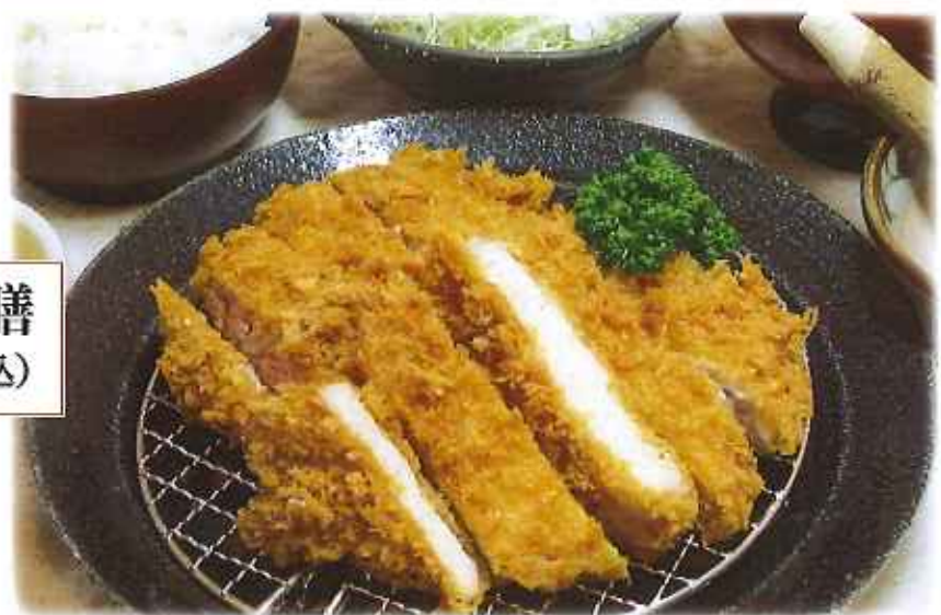
ボリュームたっぷり! ロース&メンチかつ膳 1,260円(税込)