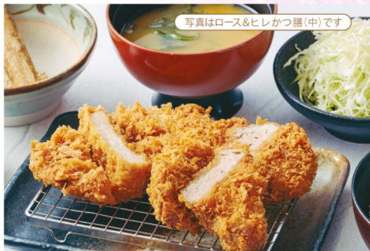
写真はロース&ヒレかつ膳(中)です