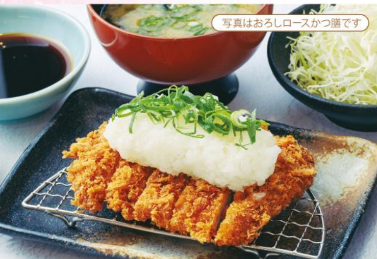
写真はおろしロースかつ膳です

大 1,320円 (税込1,452円) 中 1,260円 (税込1,386円) 小 1,070円 (税込1,177円)