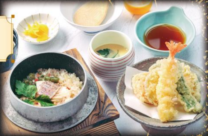
釜飯刺身膳 1,640円(税込1,804円)