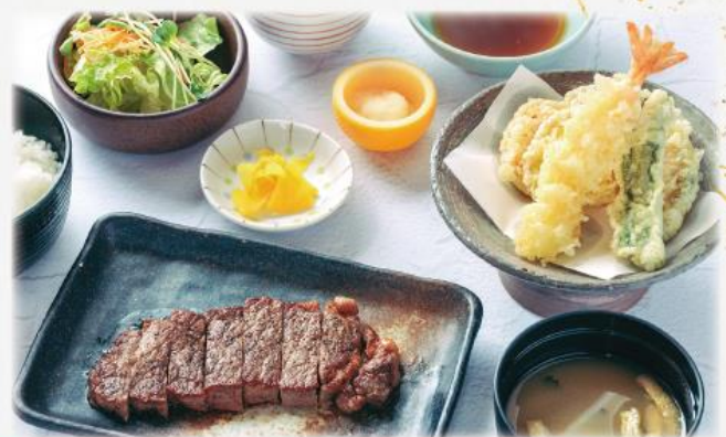
季の屋 サーロイン牛ステーキ天ぷら膳 1,870円(税込2,057円)