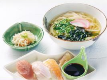
寿司&うどん膳 660円(税込726円)