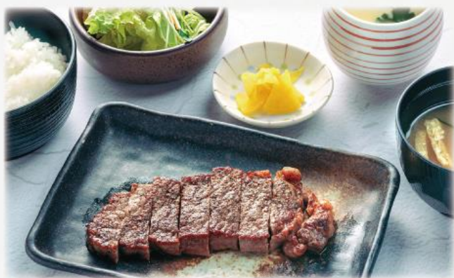
季の屋 サーロイン牛ステーキ膳 1,390円(税込1,529円)