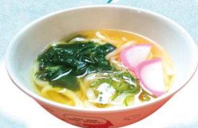
おこさまうどん 370円(税込407円)