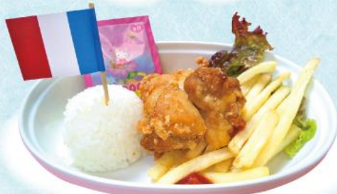
おこさま唐ポテプレート 440円(税込484円)