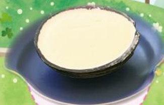
はんぶん ココナツ 460円(税込506円)