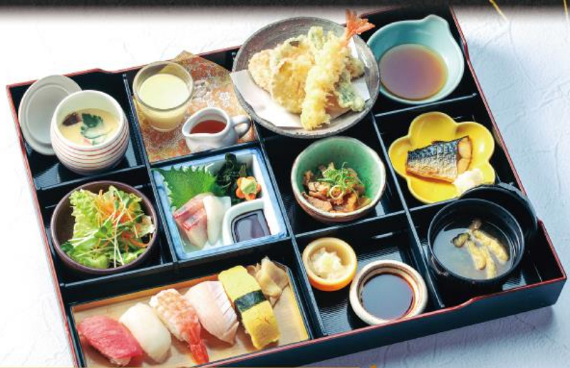
にぎ わかいせきぜん 季の屋 握り和懐石膳 2,190円(税込2,409円)