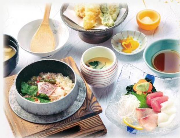
釜飯御膳 2,100円(税込2,310円)

※表示価格は全て10%税込価格です。 ※国産米を使用しています。 ※こちらのメニューは平日昼限定メニューです。 ※写真はイメージです。