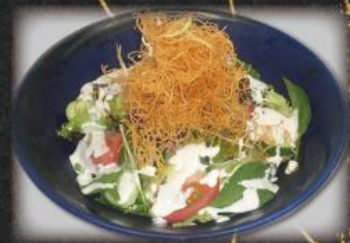
パリパリシーザーサラダ