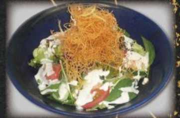
パリパリシーザーサラダ