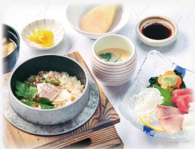
釜飯刺身膳 1,640円(税込1,804円)