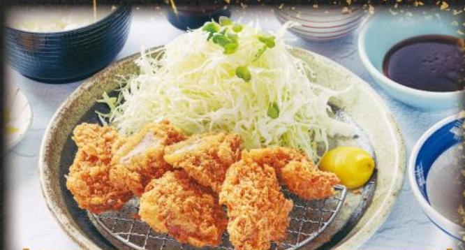
やわらかヒレかつ膳 1,390円(税込1,529円)