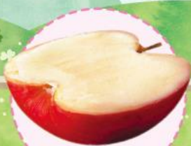
はんぶん アップル 460円(税込506円)