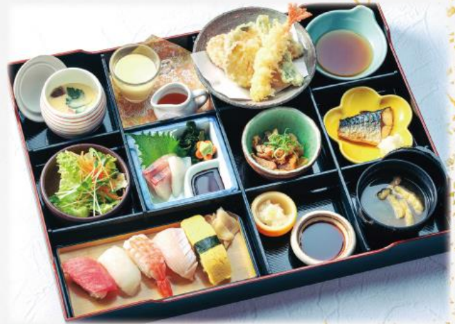
わかいせきぜん 季の屋 握り和懐石膳 2,190円(税込2,409円)