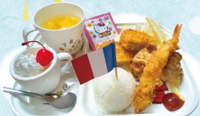
おこさまランチ 750円(税込825円)