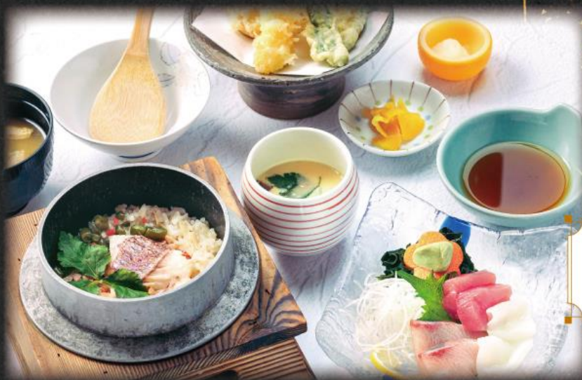
釜飯御膳 2,100円(税込2,310円)