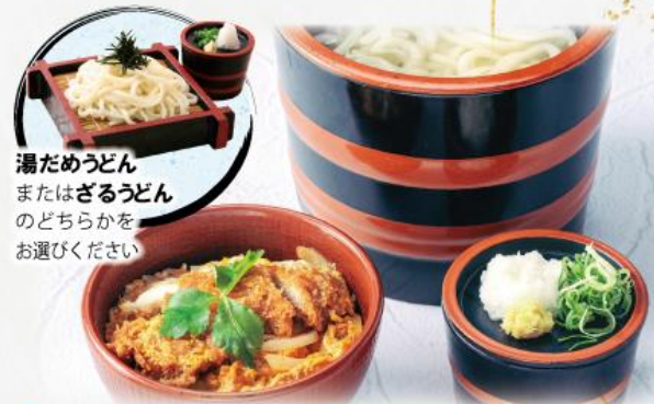
湯だめうどん またはざるうどん のどちらかを お選びください