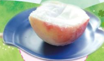
はんぶん ピーチ 460円(税込506円)