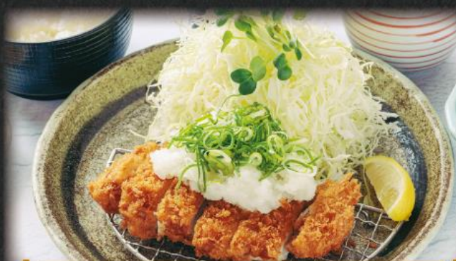
おろしローズかつ膳 1,390円(税込1,529円)