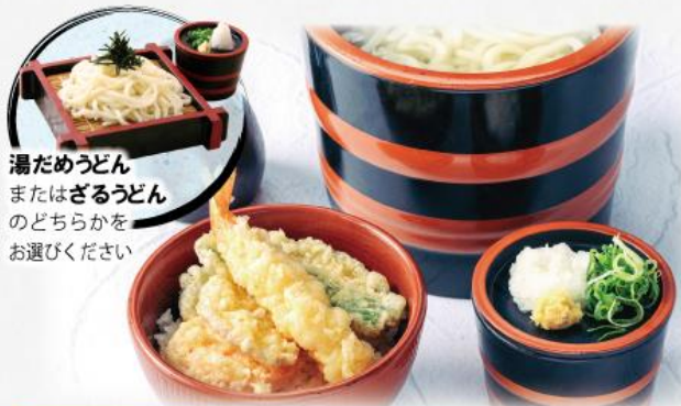
湯だめうどん またはざるうどん のどちらかを お選びください