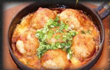
揚げタコ チーズ焼