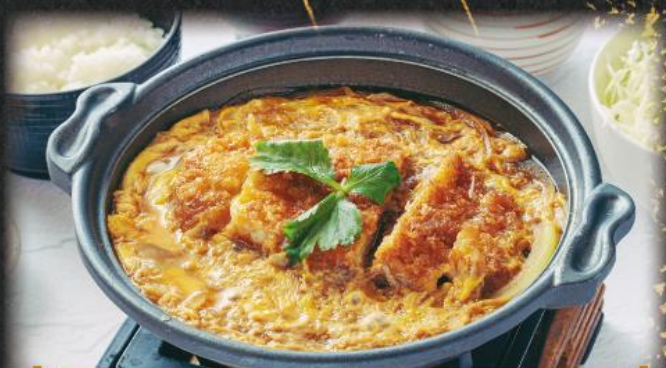
ローズかつ鍋膳 1,390円(税込1,529円)