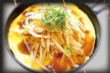
もやたま ソース鉄板