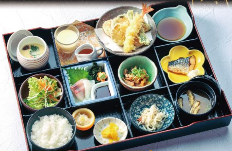
わかいせきぜん 季の屋 和懐石膳 1,730円(税込1,903円)