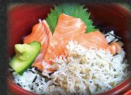
しらす サーモン丼