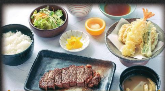
季の屋 サーロイン牛ステーキ天ぷら膳 1,870円(税込2,057円)