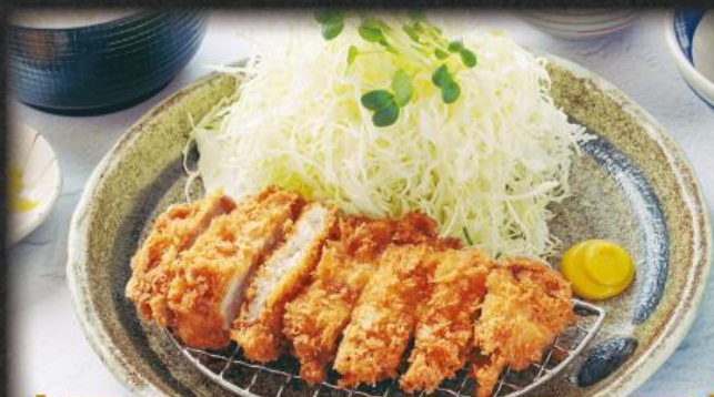
ローズかつ膳 1,300円(税込1,430円)