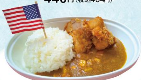
おこさま唐あげカレー 490円(税込539円)