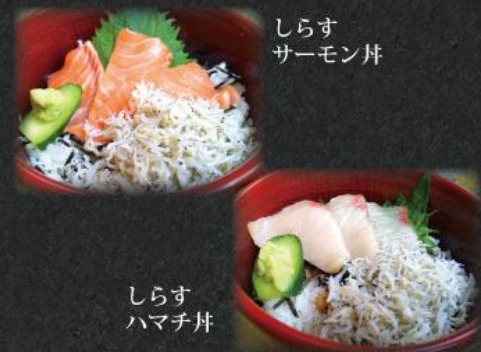
しらす サーモン丼