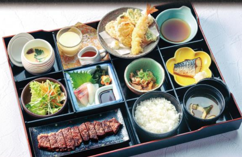
わかいせきぜん 季の屋 サーロイン牛ステーキ 和懐石膳 2,640円(税込2,904円)