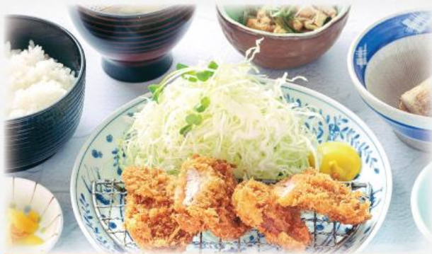
ランチヒレかつ膳 1,200円(税込1,320円)