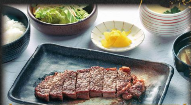
季の屋 サーロイン牛ステーキ膳 1,390円(税込1,529円)