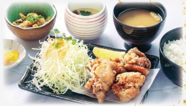
唐揚げ膳 1,020円(税込1,122円)