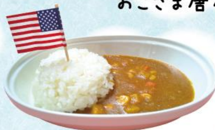
おこさまカレー 440円(税込484円)