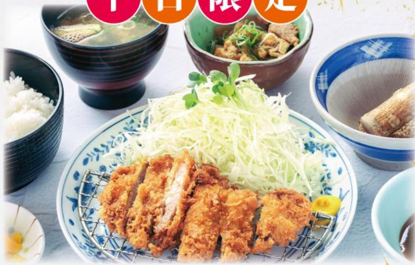
ランチロスかつ膳 1,110円(税込1,221円)