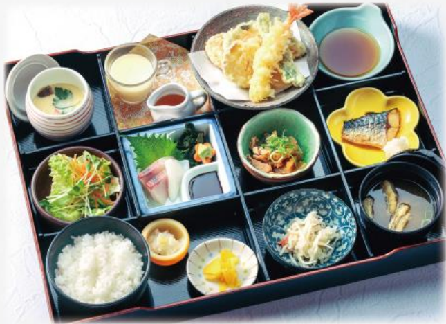
わかいせきぜん 季の屋 和懐石膳 1,730円(税込1,903円)