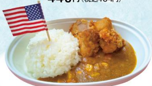
おこさま唐あげカレー 490円(税込539円)