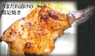
うまだれ漬けの 鶏足焼き