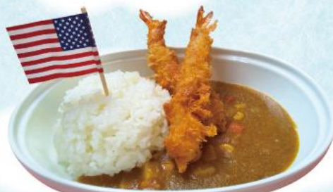
おこさまエビフライカレー 490円(税込539円)