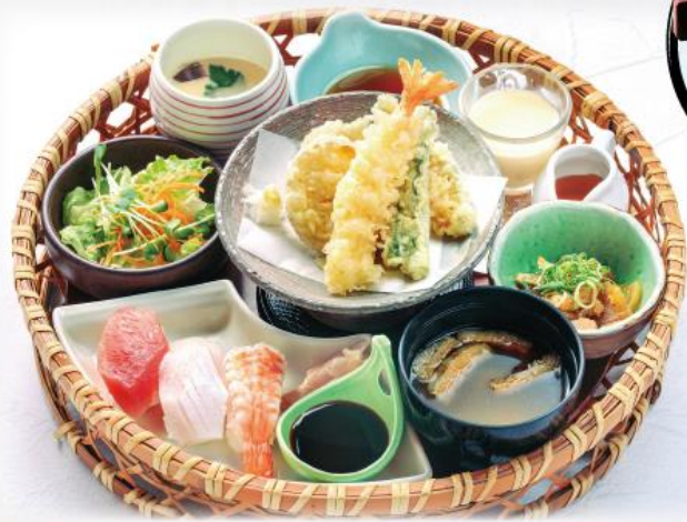
花籠寿司膳 1,320円(税込1,452円)