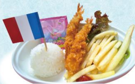
おこさまエビポテプレート 440円(税込484円)