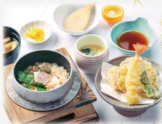
釜飯天ぷら膳 1,500円(税込1,650円)