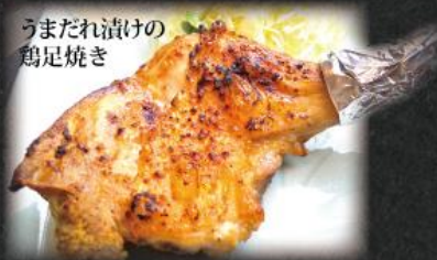
うまだれ漬けの 鶏足焼き