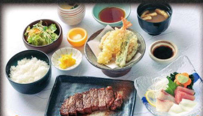
季の屋 サーロイン牛ステーキ御膳 2,460円(税込2,706円)