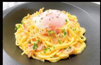
カルボナーラ 900円 (税込 990円)