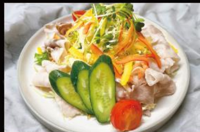
冷しゃぶサラダ 720 円 (税込 792 円)