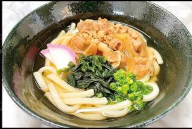
肉うどん 820円 (税込 902円)