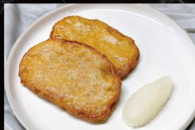
愛媛八幡名物じゃこ天 500 円 (税込 550 円)