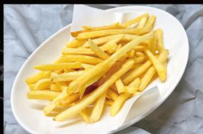
フライドポテト 520 円 (税込 572 円)