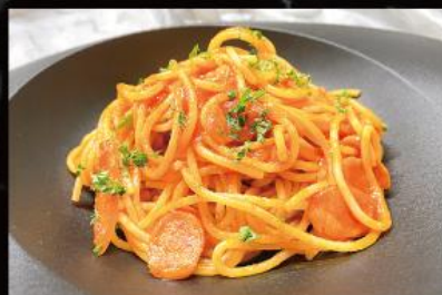
ナポリタン 890円 (税込 979円)