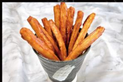
ごぼうスティック 630 円 (税込 693 円)