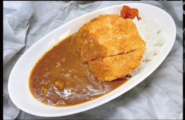
三元豚カツカレー 1,180 円 (税込 1,298 円)