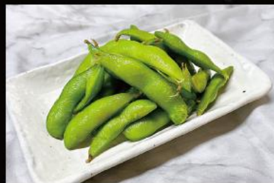
塩茹で枝豆 410 円 (税込 451 円)