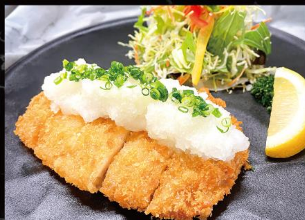
三元豚おろしロースカツ定食 1,430円 (税込 1,573円)