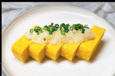
だし巻き卵 570 円 (税込 627 円)