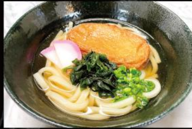
じゃこ天うどん 810円 (税込 891円)