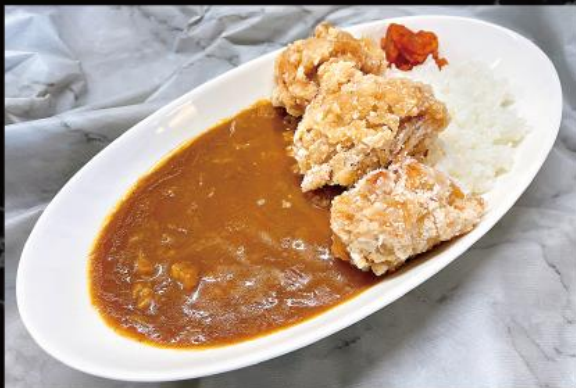
唐揚げカレー 1,180 円 (税込 1,298 円)