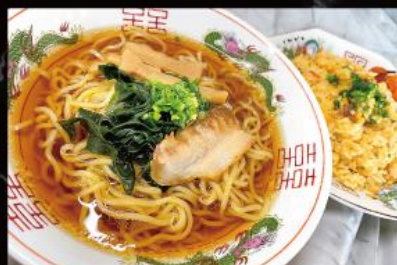
しょうゆラーメン&チャーハン 1,360円 (税込 1,496円)