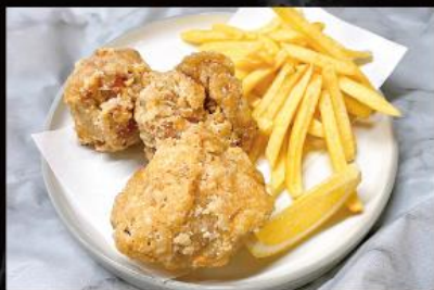
唐揚げ&ポテト 660 円 (税込 726 円)