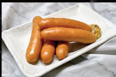
粗挽きウィンナー 500 円 (税込 550 円)