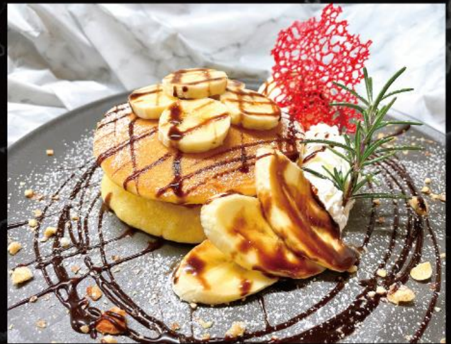
チョコバナナパンケーキ 1,060 円 (税込 1,166 円)