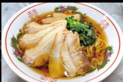
チャーシュー麺 900円 (税込 990円)