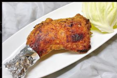
丸亀名物骨付き鳥 1,450 円 (税込 1,595 円)