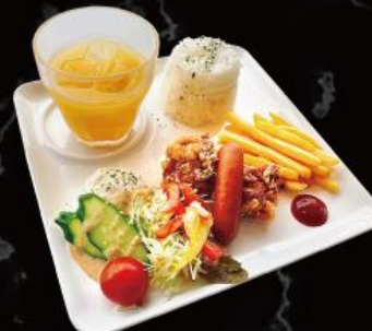
おこさまランチ 820 円 (税込 902 円)