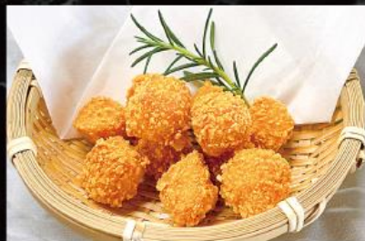
チーズボール 630 円 (税込 693 円)