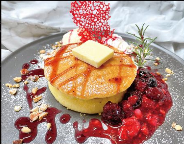
ミックスベリーパンケーキ 1,050 円 (税込 1,155 円)