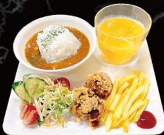
おこさまカレー 820 円 (税込 902 円)