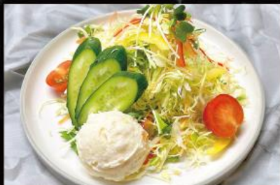
野菜サラダ 440 円 (税込 484 円)