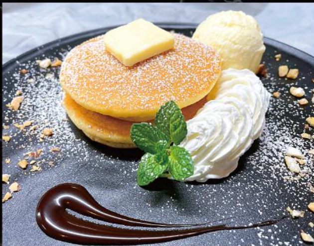
パンケーキ 870 円 (税込 957 円)