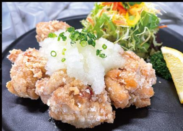
鶏みぞれ唐揚げ定食 1,410円 (税込 1,551円)