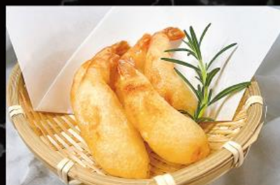
海老フリッター 630 円 (税込 693 円)