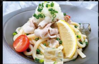
冷しゃぶうどん 900円 (税込 990円)