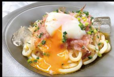
ねぎトロ温玉冷やしうどん 1,150円 (税込 1,265円)