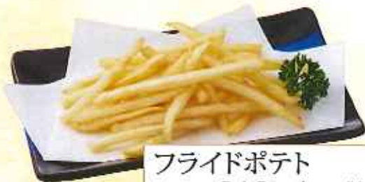
フライドポテト 216円(8%税込)