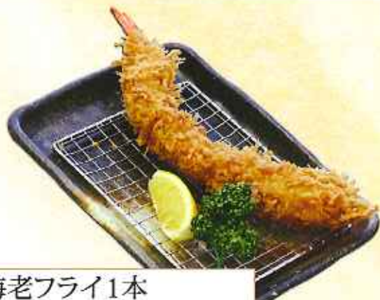
海老フライ1本 463円(8%税込)