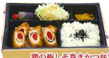
鶏の梅しそ巻きかつ弁当 843円(8%税込)