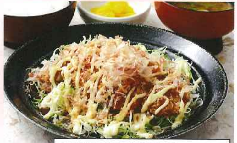
お好みチキンかつ膳 1,049円(8%税込)