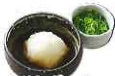
おろしポン酢 103円(8%税込)