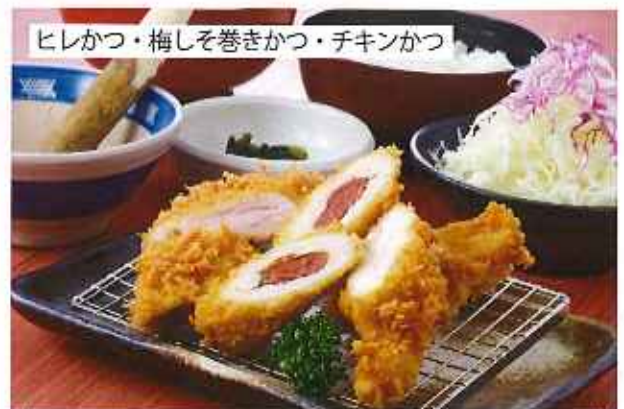
ヒレかつ・梅しそ巻きかつ・チキンかつ