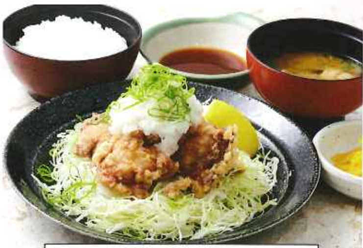
みぞれ唐揚げ膳 1,049円(8%税込)