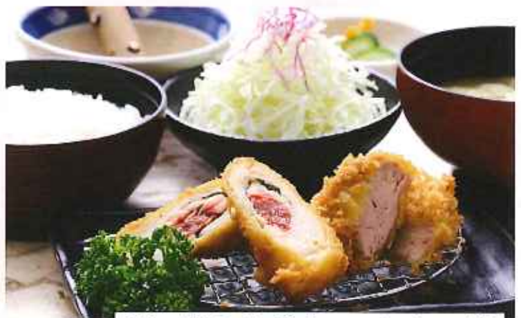
鶏の梅しそ巻き&ヒレかつ膳 915円(8%税込)