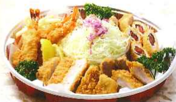
写真はオードブル(中)のイメージです。