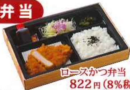
ロースかつ弁当 822円(8%税込)