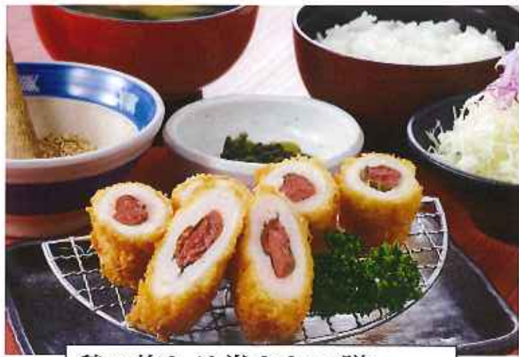
鶏の梅しそ巻きかつ膳 1,070円(8%税込)