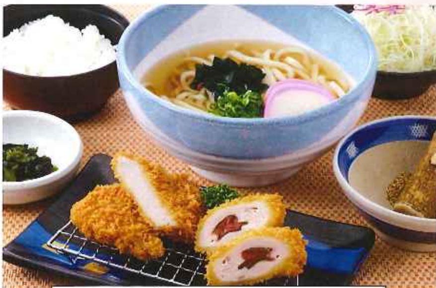
TONうどんセット ヒレかつ・鶏の梅しそ巻き 1,122円(8%税込)