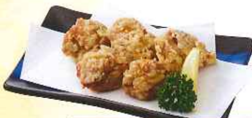
鶏の唐揚げ 411円(8%税込)