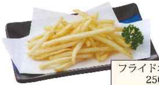
フライドポテト 250円(8%税込)