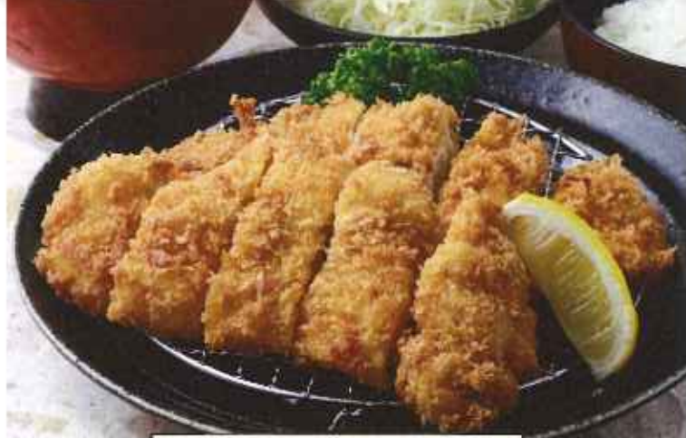
Wチキンかつ膳 1,200円(8%税込)