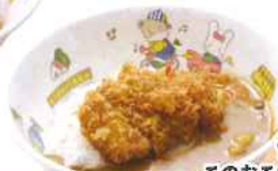
おこさまミニかつカレー丼 420円(8%税込)