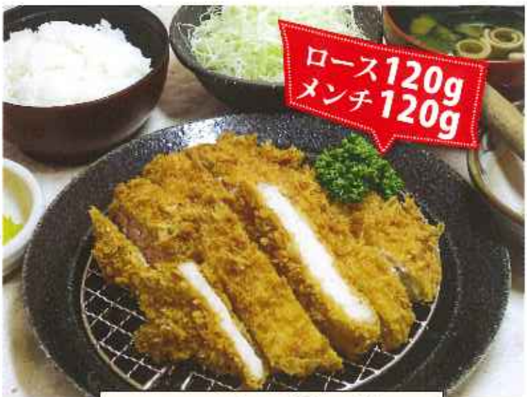
ロース&メンチかつ膳 1,250円(8%税込)