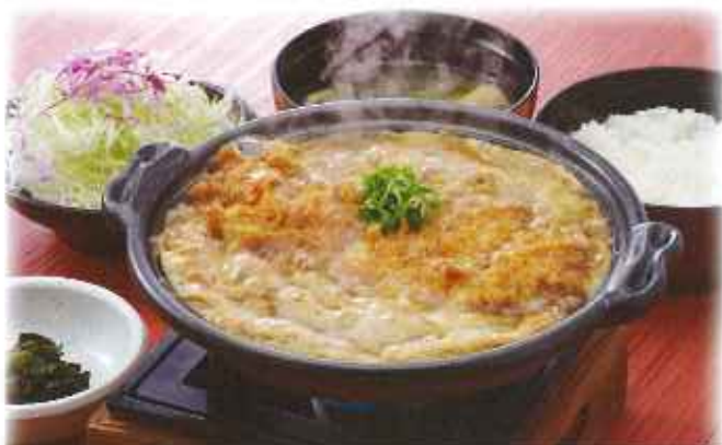
ローズかつ鍋膳 1,330円(8%税込)