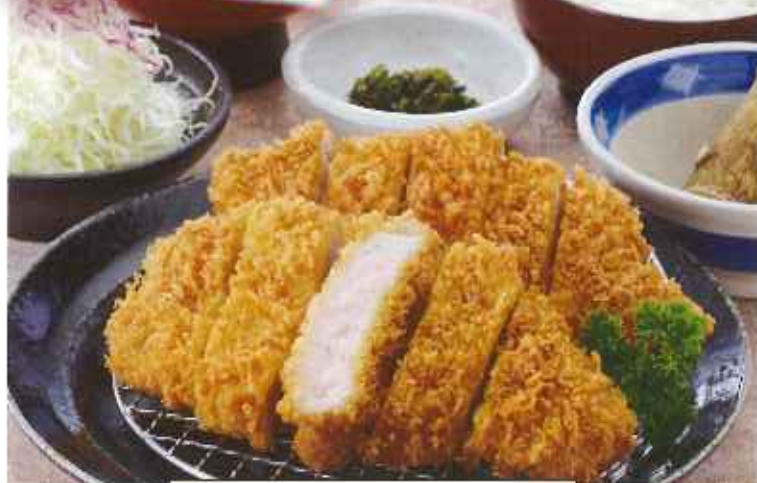
Wロースかつ膳 1,450円(8%税込)