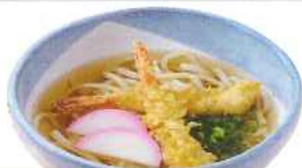
海老天ぷらうどん