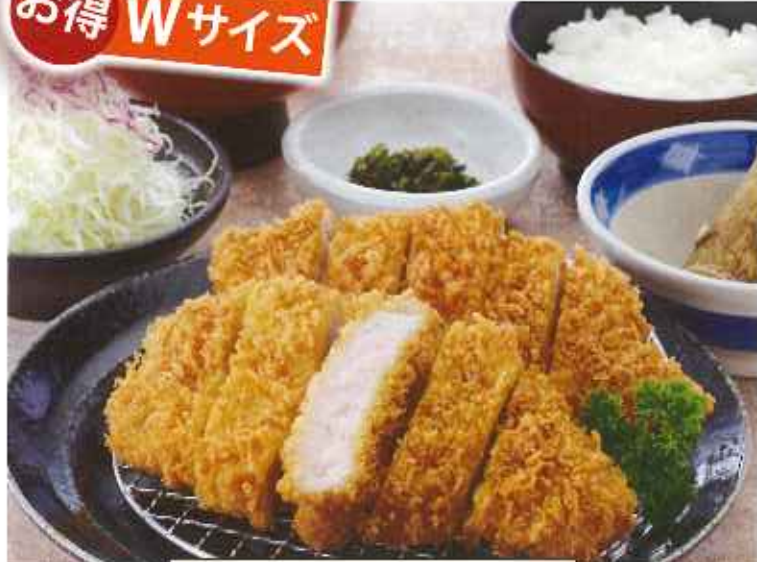
Wロースかつ膳 1,450円(8%税込)