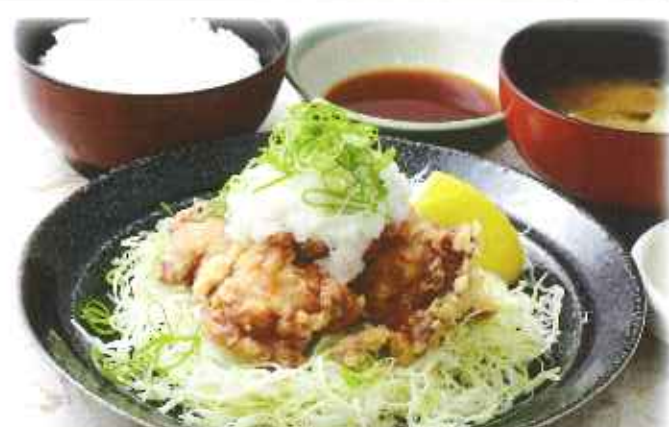
みぞれ唐揚げ膳 1,070円(8%税込)