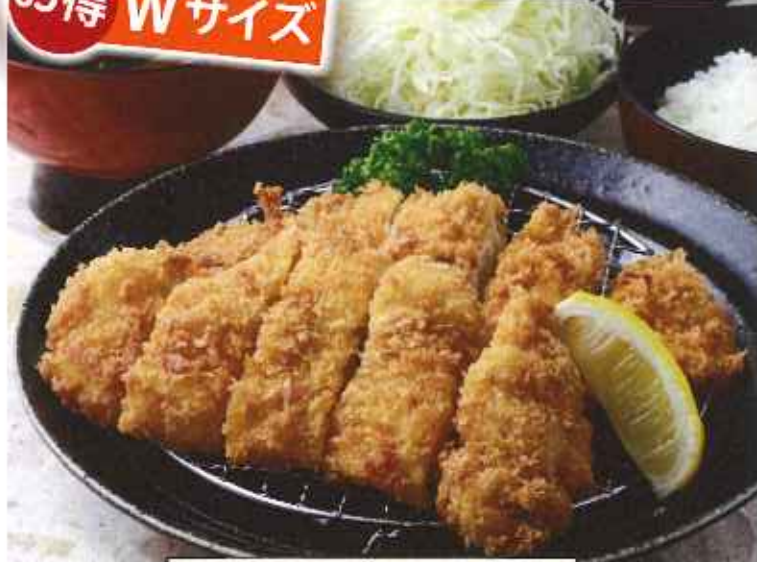
Wチキンかつ膳 1,200円(8%税込)