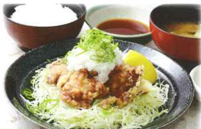
みぞれ唐揚げ膳 1,070円(8%税込)