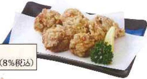
鶏の唐揚げ 440円(8%税込)