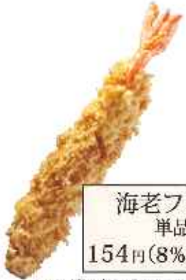
海老フライ 単品1尾 154円(8%税込)