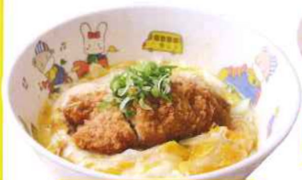
おこさまミニかつ丼 370円(8%税込)