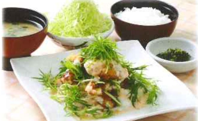
とろろと水菜のチキンかつ 1,150円(8%税込)