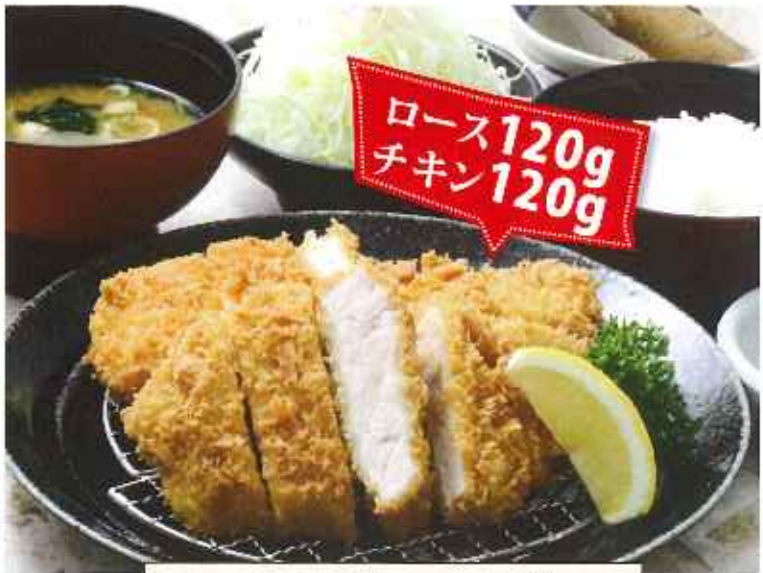
ロース&チキンかつ膳 1,250円(8%税込)