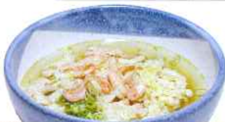
海老入野菜かきあげうどん