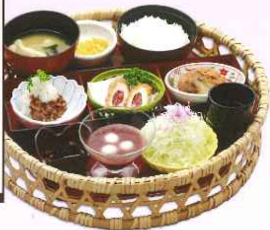
とろろと水菜のチキンかつ 1,150円(8%税込)