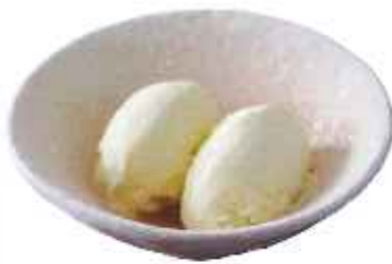
バニラアイス 220円(8%税込)