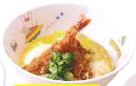
おこさまミニえび丼 370円(8%税込)