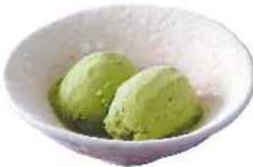
バニラ& 抹茶アイス 220円(8%税込)