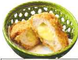
チーズメンチかつ 60g 1個 270円(8%税込)