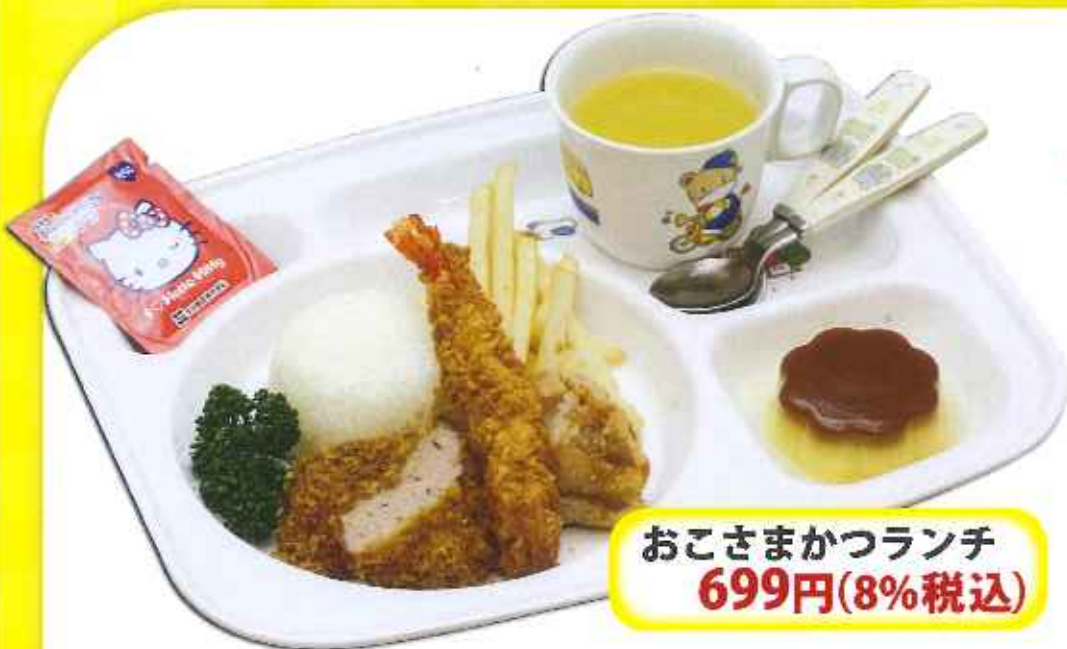
おこさまかつランチ 699円(8%税込)