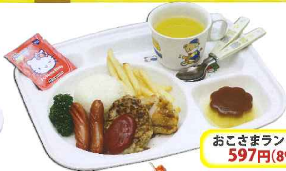
おこさまランチ 597円(8%税込)