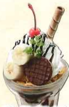
チョコバナナパフェ 638円(8%税込)