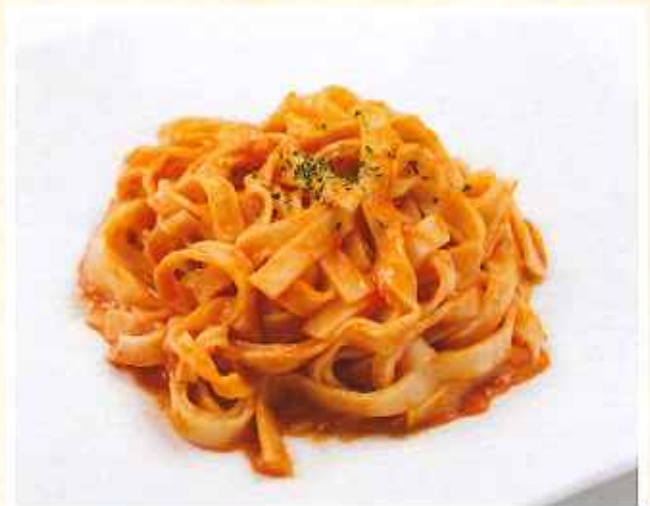
生パスタ 蟹とトマトクリーム 810円(8%税込)