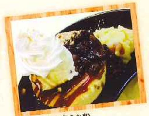
鳴門金時の黒蜜きな粉 パンケーキ