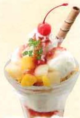
フルーツパフェ 638円(8%税込)