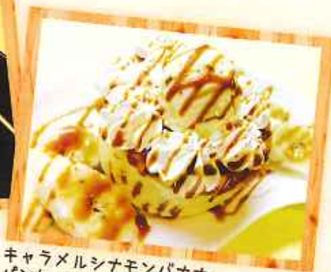
キャラメルシナモンバナナ パンケーキ