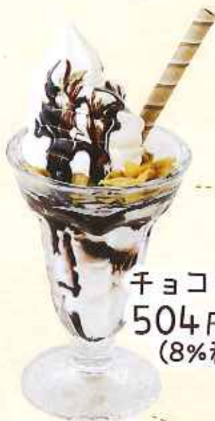
チョコソフト 504円 (8%税込)