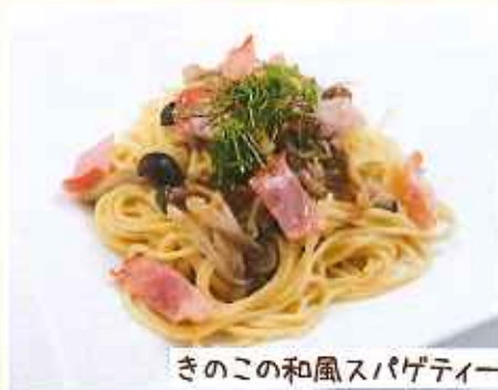
きのこの和風スパゲティー