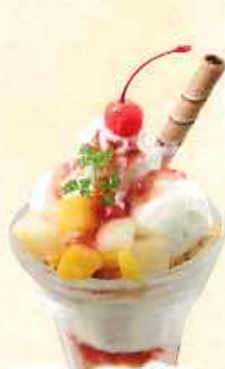
フルーツパフェ 638円(8%税込)