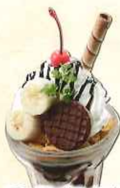
チョコバナナパフェ 638円(8%税込)