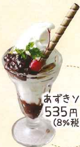
あずきソフト 535円 (8%税込)