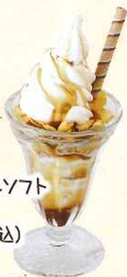
キャラメルソフト 504円 (8%税込)