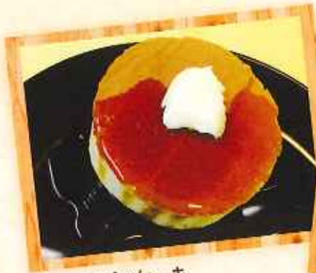
プレーンパンケーキ