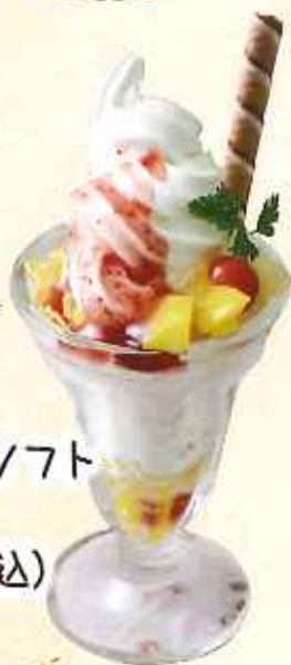
フルーツソフト 535円 (8%税込)