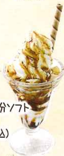
黒蜜きな粉ソフト 504円 (8%税込)