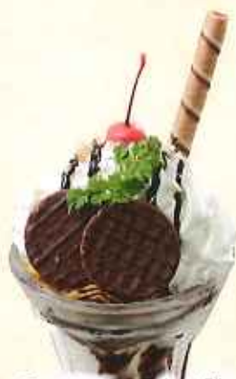
チョコレートパフェ 606円(8%税込)