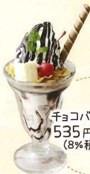
チョコバナナソフト 535円 (8%税込)