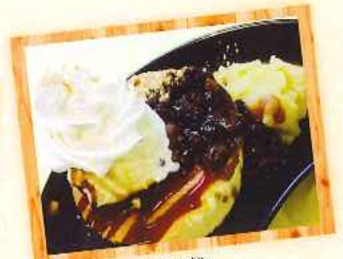
鳴門金時の黒蜜きな粉 パンケーキ