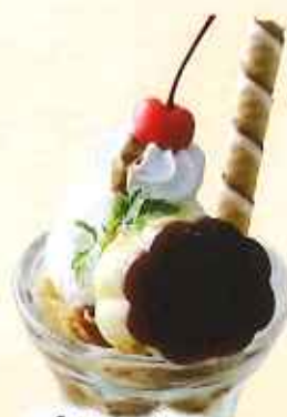
プリンパフェ 606円(8%税込)