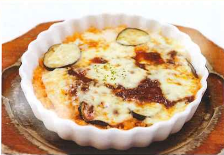
茄子のミートドリア 780円(8%税込)