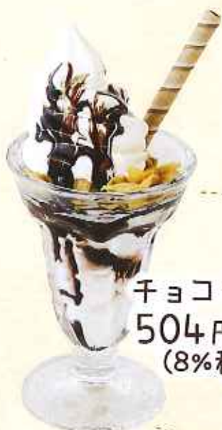
チョコソフト 504円 (8%税込)