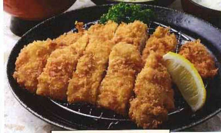
Wチキンかつ膳 1,200円(8%税込)