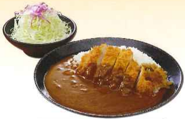
かつカレー 1,150円(8%税込)