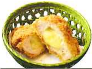
チーズメンチかつ 60g 1個 270円(8%税込)