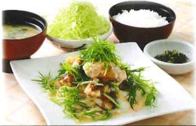
とろろと水菜のチキンかつ 1,150円(8%税込)