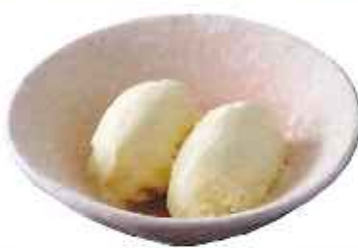
バニラアイス 220円(8%税込)