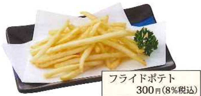
フライドポテト 300円(8%税込)