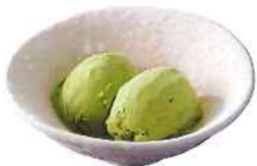
抹茶アイス 220円(8%税込)