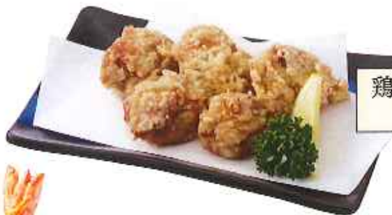
鶏の唐揚げ 420円(8%税込)