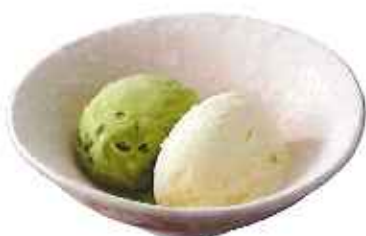
バニラ& 抹茶アイス 220円(8%税込)