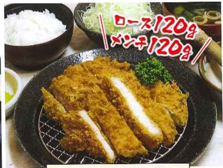
ローズ&メンチかつ膳 1,250円(8%税込)