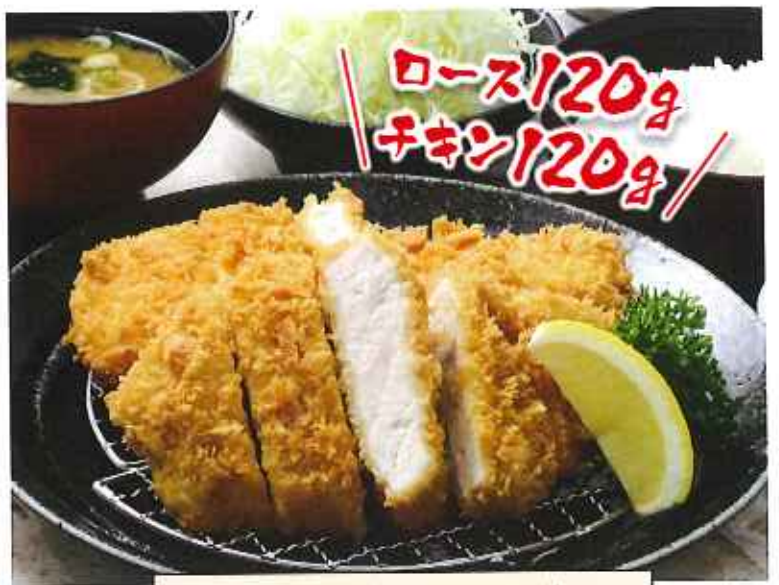
ローズ&チキンかつ膳 1,250円(8%税込)