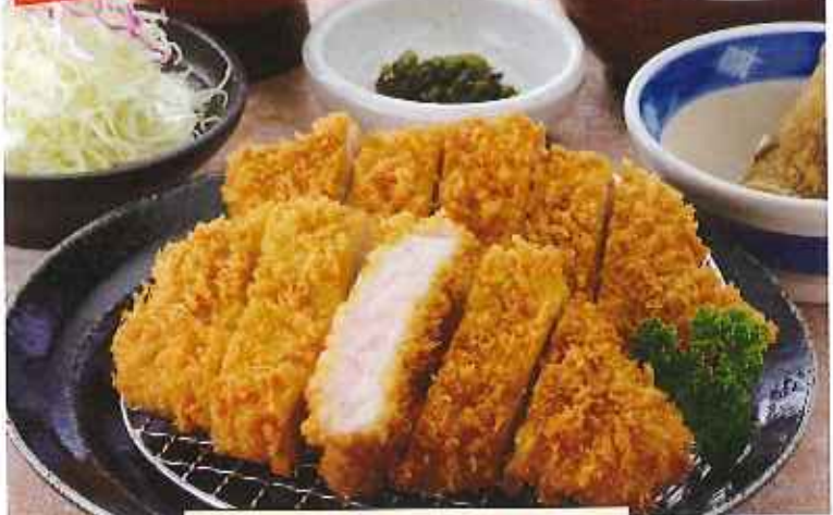
Wロースかつ膳 1,350円(8%税込)