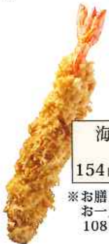
海老フライ 単品1尾 154円(8%税込)