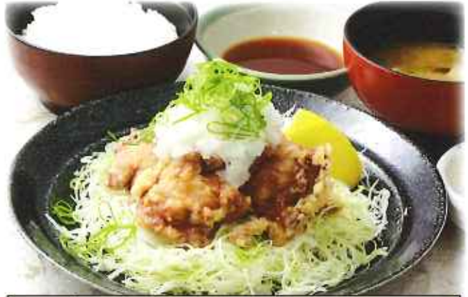
みぞれ唐揚げ膳 1,070円(8%税込)