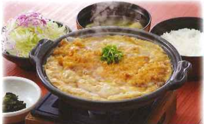
ローズかつ鍋膳 1,330円(8%税込)