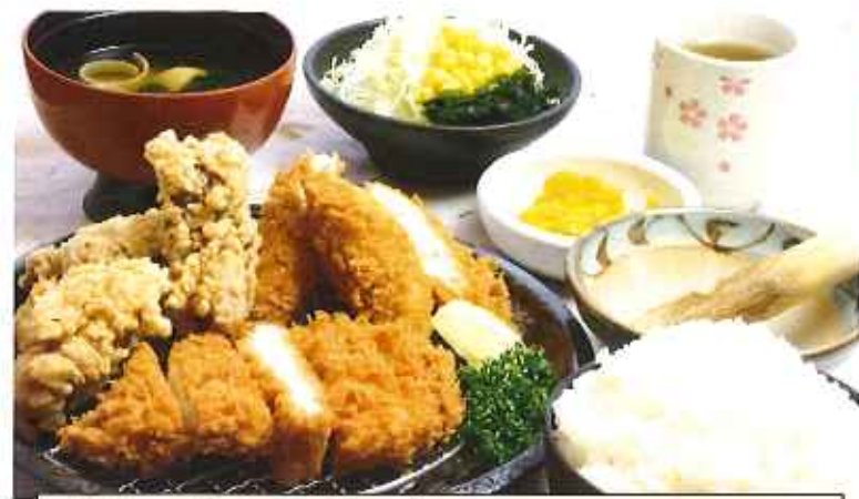
チキンちきんChicken 1,100円(8%税込)