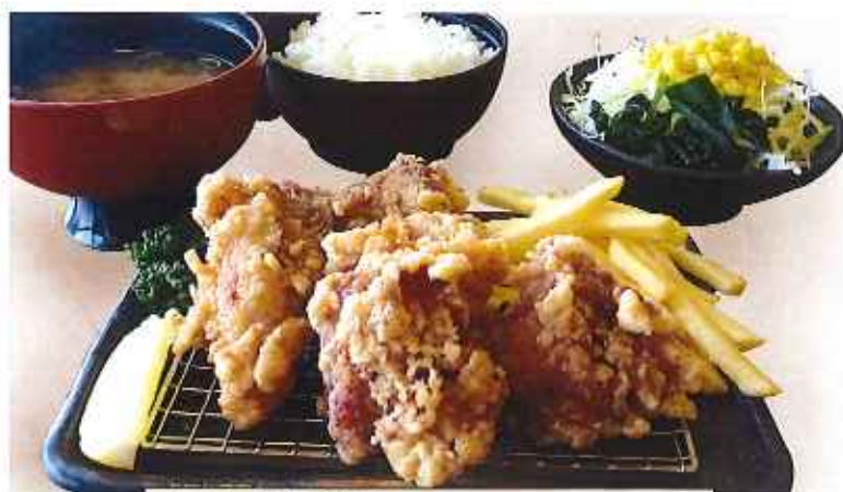
から揚げ膳 980円(8%税込)