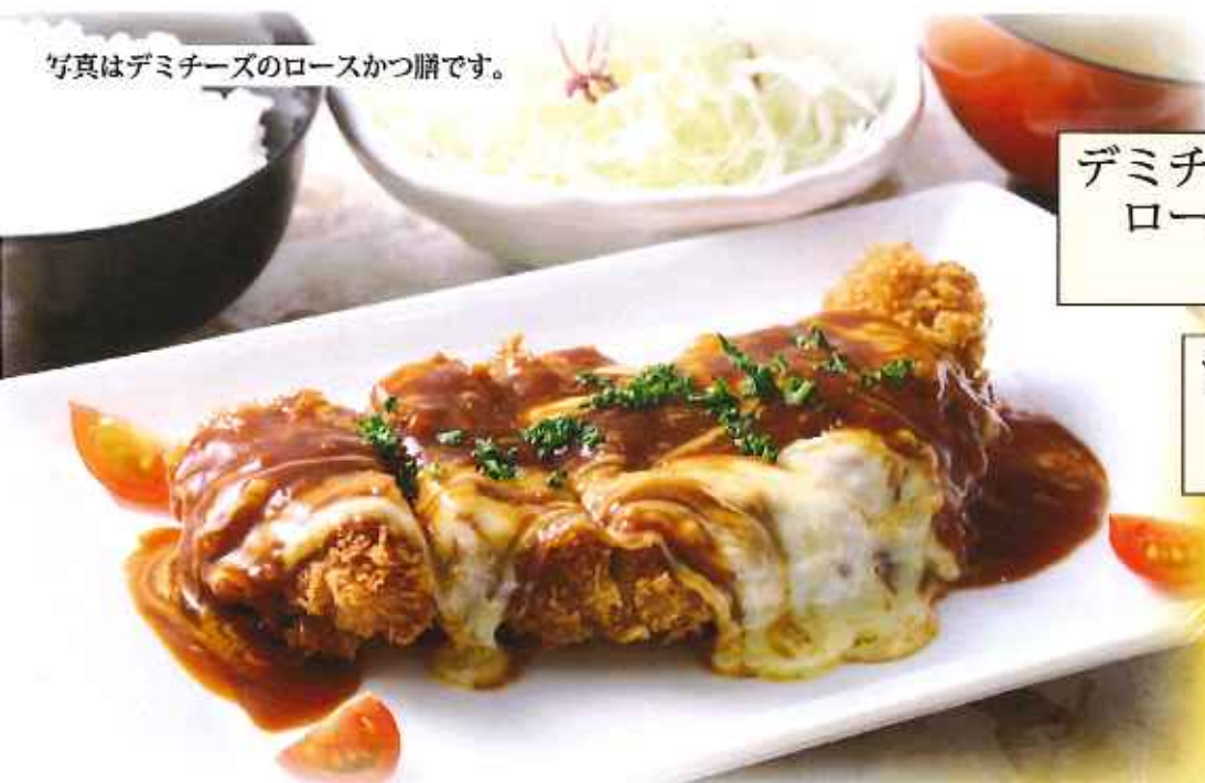
デミチーズの ロースかつ膳 1,250円(8%税込)