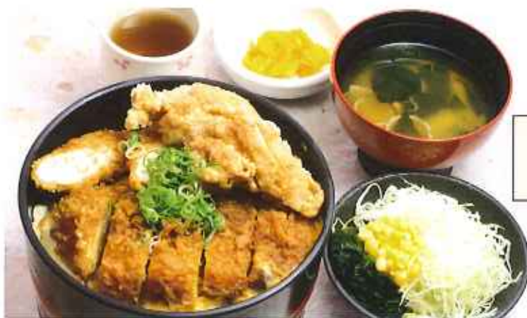
“これでもか”かつ丼 1,100円(8%税込)