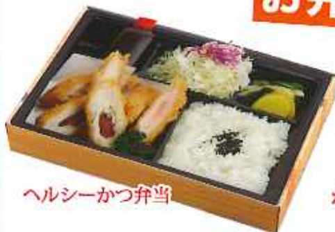
ヘルシーかつ弁当