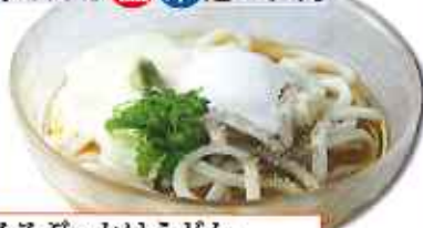
とろろぶっかけうどん