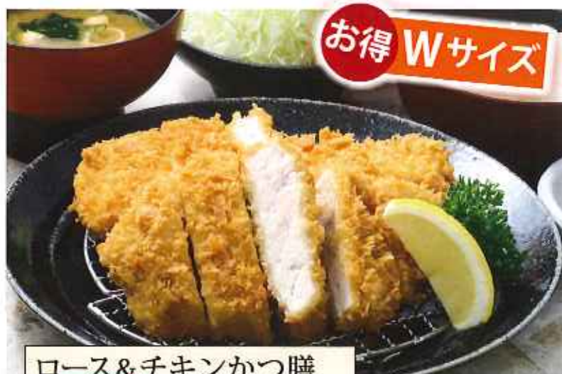
ローズ&チキンかつ膳