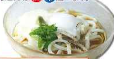
とろろぶっかけうどん