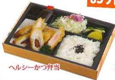
ヘルシーかつ弁当