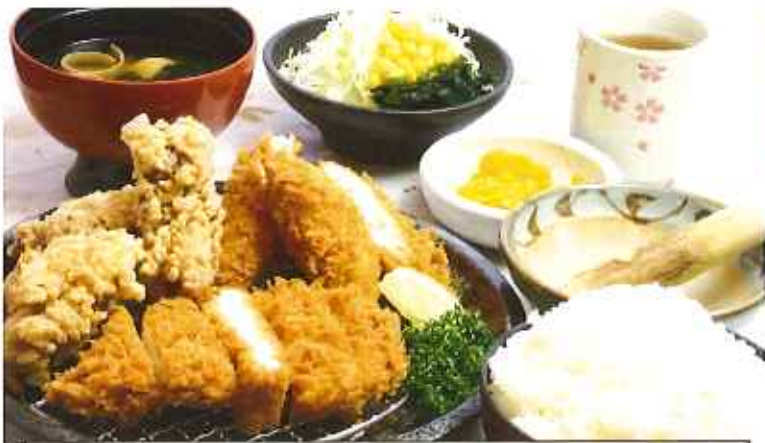
チキンちきんChicken 1,120円(8%税込)