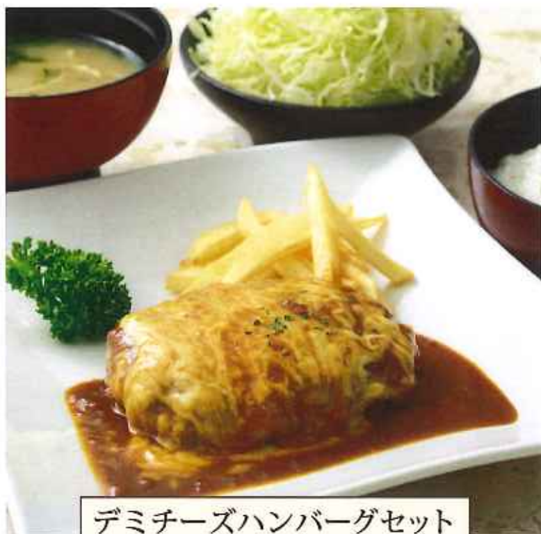
デミチーズハンバーグセット 1,200円(8%税込)