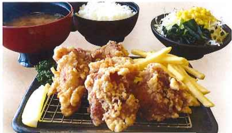
から揚げ膳 980円(8%税込)