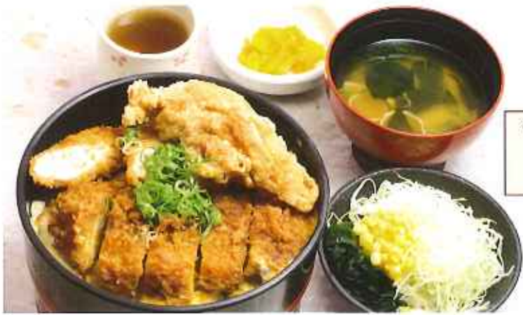
“これでもか”かつ丼 1,100円(8%税込)