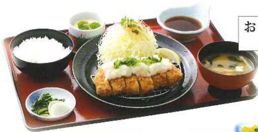
おろしローズかつ膳 1,580円(税込)