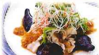
イベリコ豚とんかつサラダ 880円(税込)