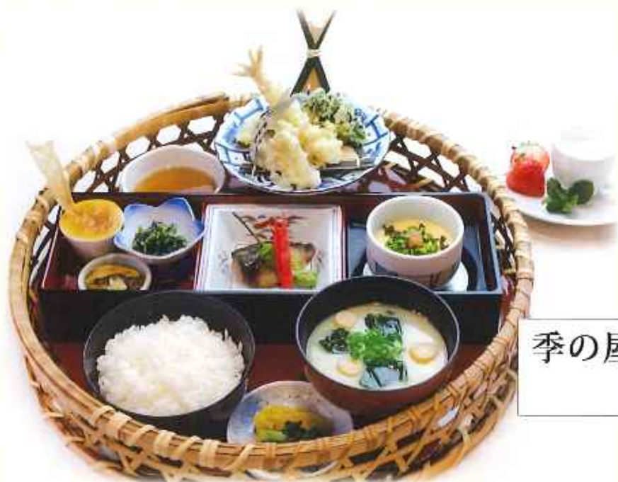
季の屋華かご天麩羅膳 1,580円(税込)