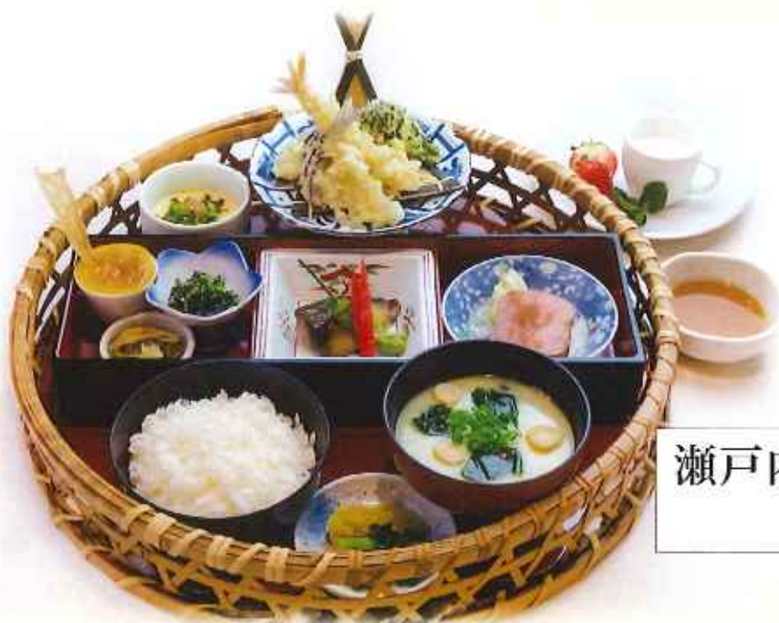
瀬戸内華かご膳 1,680円(税込)