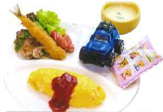
お子様ランチ 780円(税込)