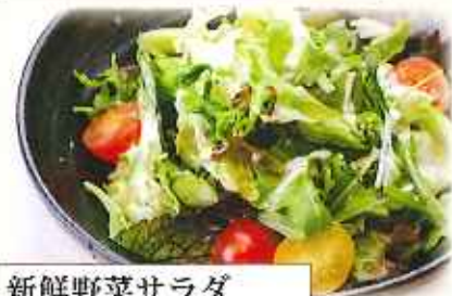
新鮮野菜サラダ 780円(税込)