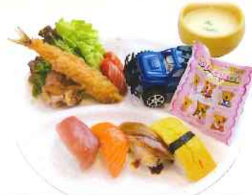
お子様寿司セット 980円(税込)