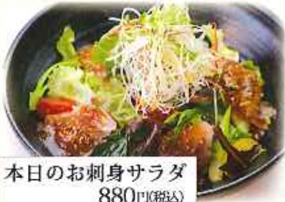
本日のお刺身サラダ 880円(税込)