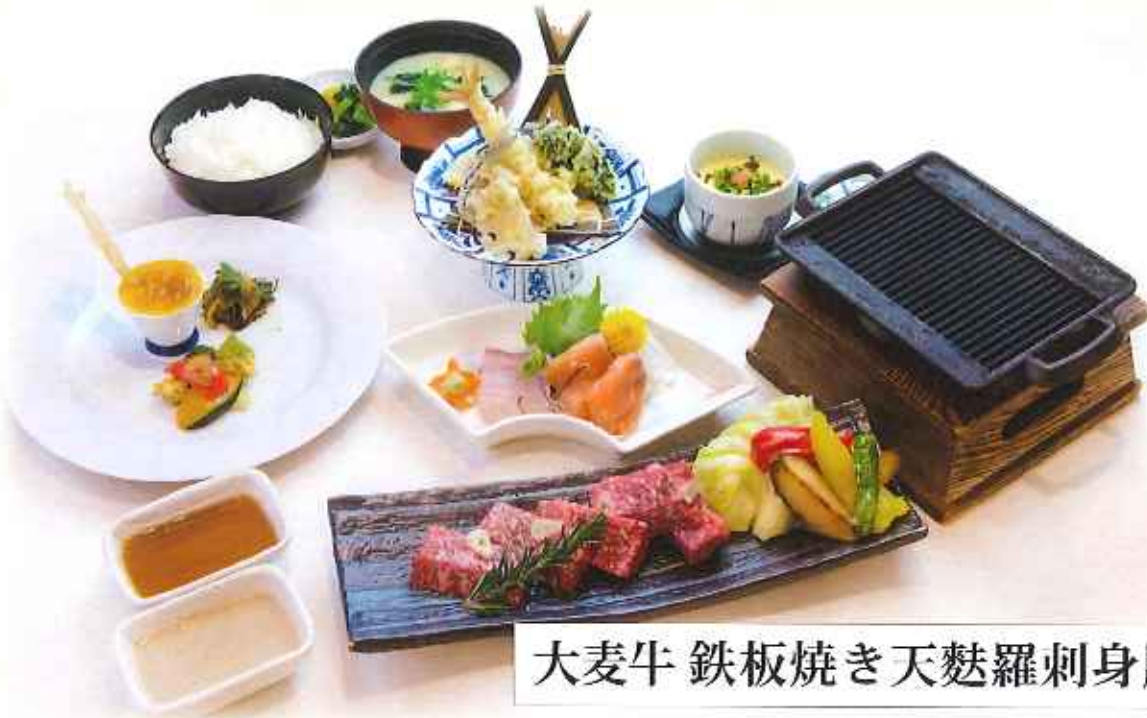
大麦牛 鉄板焼き天麩羅刺身膳 2,800円(税込)