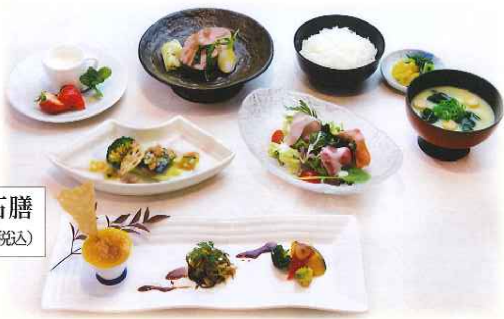
旬彩洋風懐石膳 2,280円(税込)