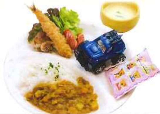
お子様カレーセット 880円(税込)