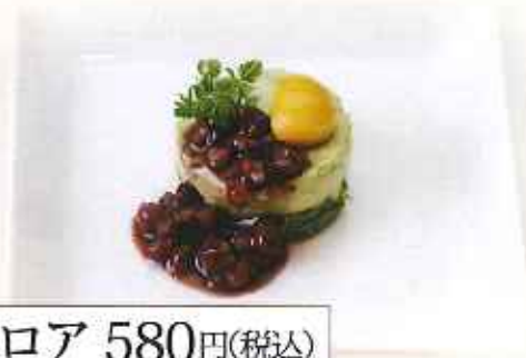
抹茶ババロア 580円(税込)