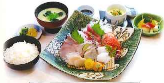
本日のお刺身御膳 1,600円(税込)