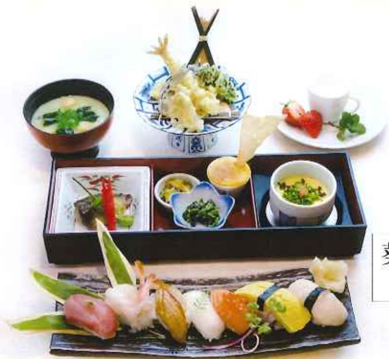
葵握り寿司和懐石膳 2,080円(税込)