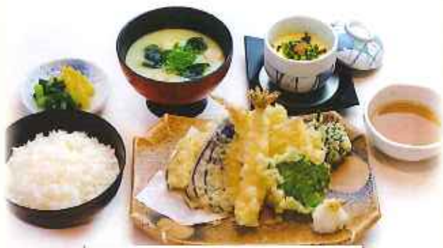
旬の天麩羅御膳 1,380円(税込)