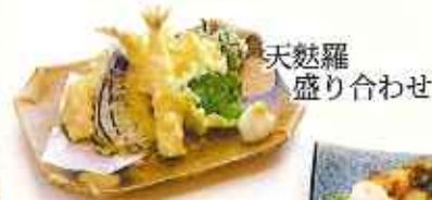
天麩羅 盛り合わせ