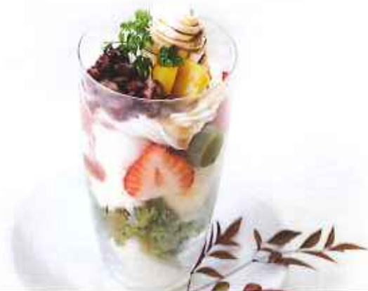
小豆&抹茶わらび餅パフェ 780円(税込)