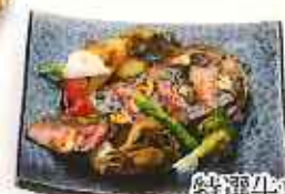
特選牛ロースステーキ