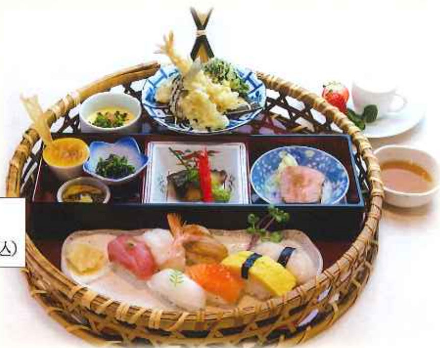
旬彩華かご寿司膳 1,980円(税込)