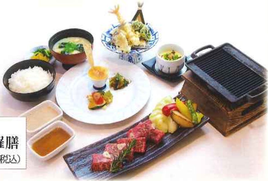
大麦牛 鉄板焼き天麩羅膳 2,500円(税込)