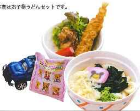
お子様うどんセット 580円(税込)