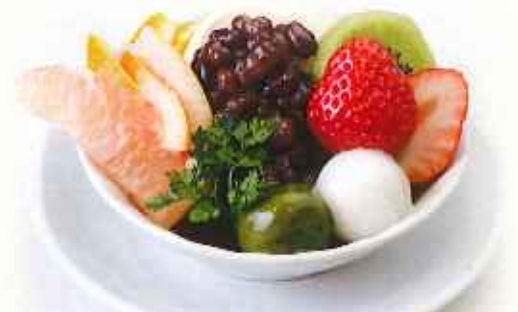
フルーツクリームあんみつ 780円(税込)