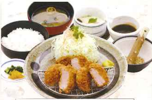
ヒレかつ膳 1,480円(税込)