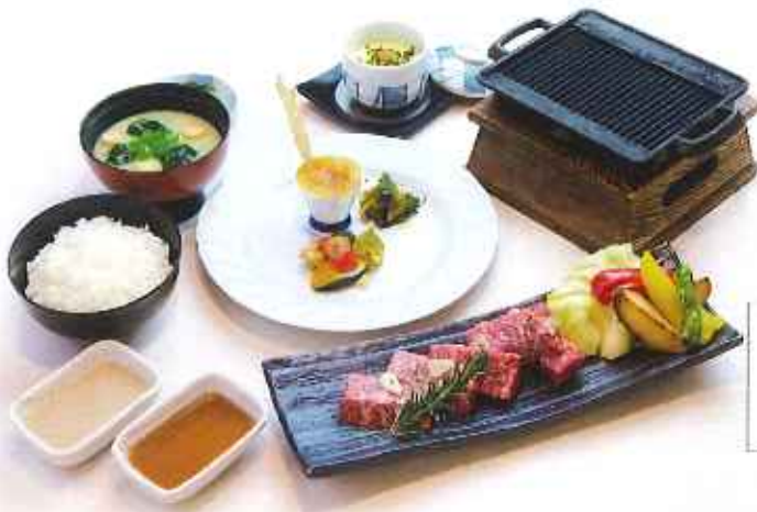
大麦牛 鉄板焼き膳 2,300円(税込)