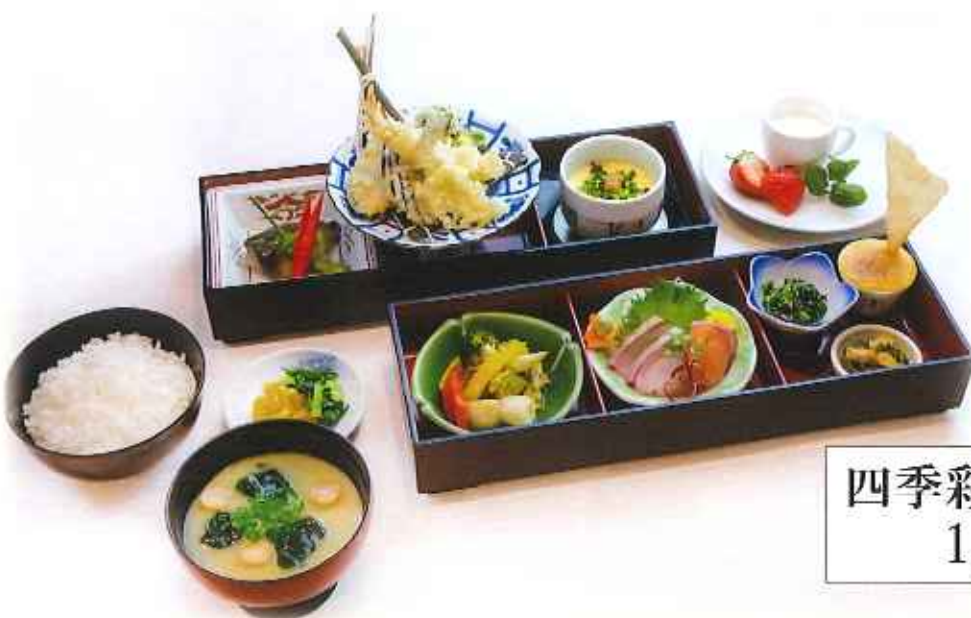
四季彩和懐石膳 1,680円(税込)