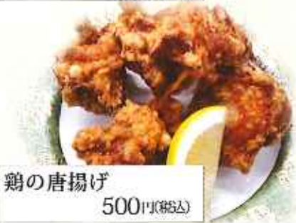
鶏の唐揚げ 500円(税込)