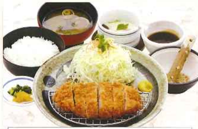
ローズとんかつ膳 1,380円(税込)