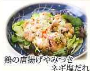
鶏の唐揚げやみつぎ ネギ塩だれ