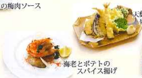
海老とポテトの スパイス揚げ