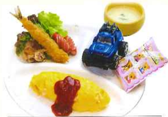
お子様ランチ 780円(税込)