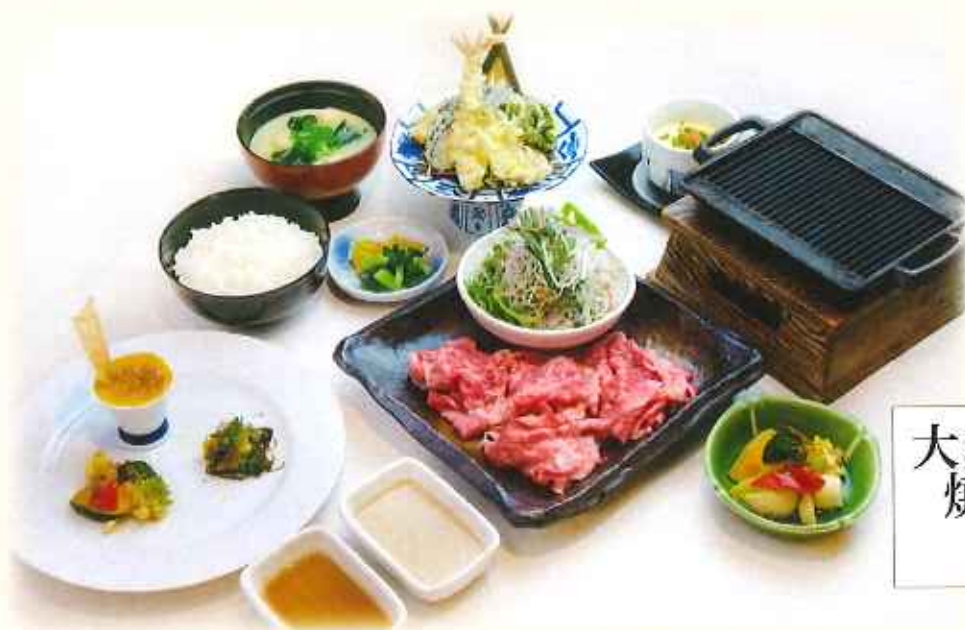
大麦牛 焼きしゃぶ天麩羅膳 2,000円(税込)