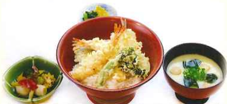
季節の天麩羅どんぶり 1,280円(税込)