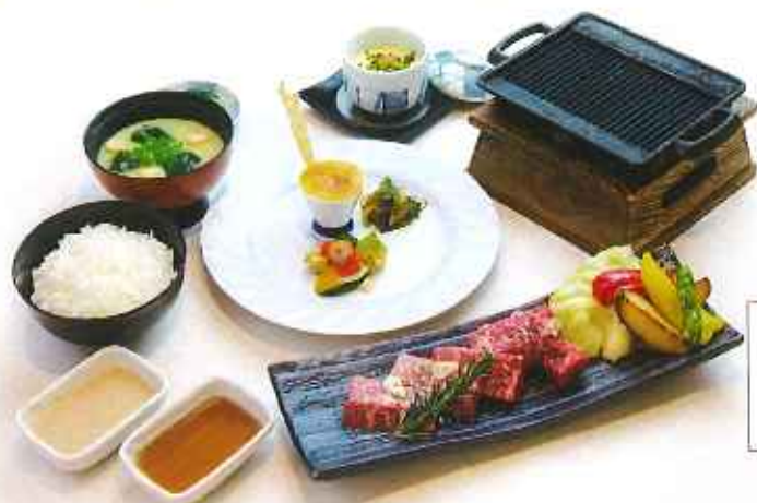
大麦牛 鉄板焼き膳 2,300円(税込)