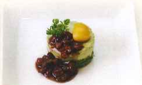
抹茶ババロア 580円(税込)