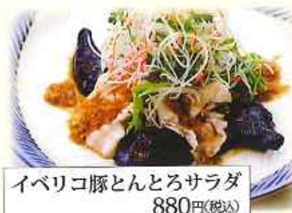
イベリコ豚とんとろサラダ 880円(税込)