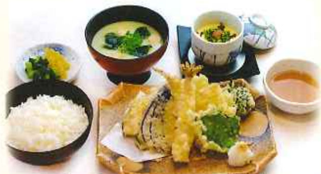
旬の天麩羅御膳 1,380円(税込)