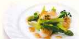
帆立とアスパラの梅肉ソース