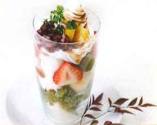
小豆&抹茶わらび餅パフェ 780円(税込)