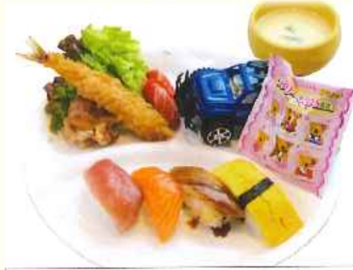
お子様寿司セット 980円(税込)