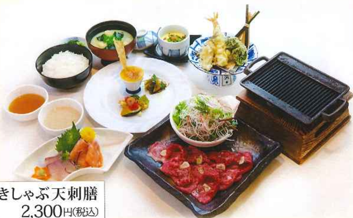
大麦牛 焼きしゃぶ天刺膳 2,300円(税込)