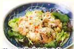
鶏の唐揚げやみつき ネギ塩だれ