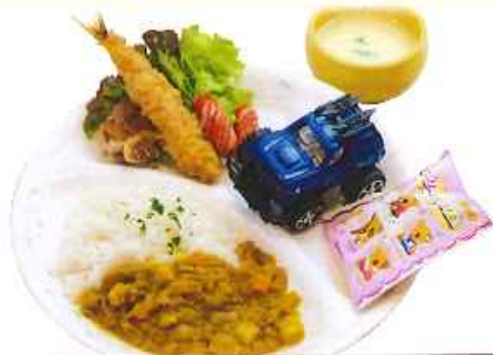
お子様カレーセット 880円(税込)