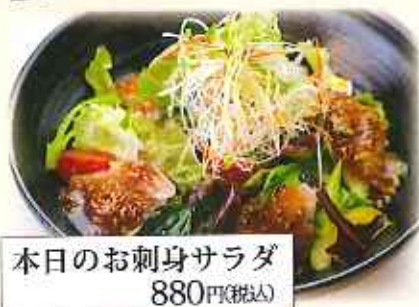
本日のお刺身サラダ 880円(税込)