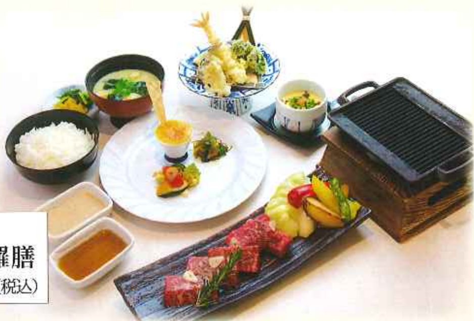
大麦牛 鉄板焼き天麩羅膳 2,500円(税込)