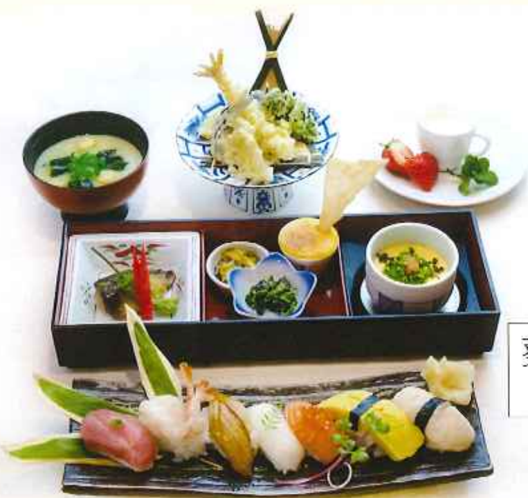
葵握り寿司和懐石膳 2,080円(税込)