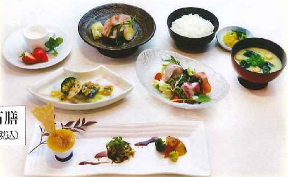
旬彩洋風懐石膳 2,280円(税込)