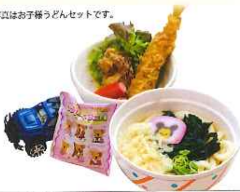
お子様うどんセット 580円(税込)