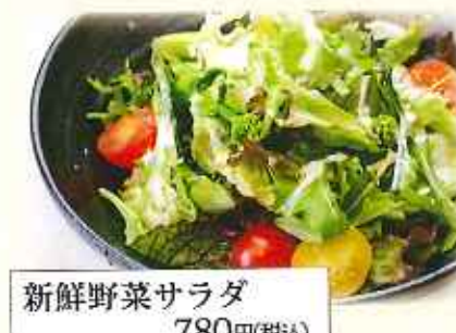
新鮮野菜サラダ 780円(税込)