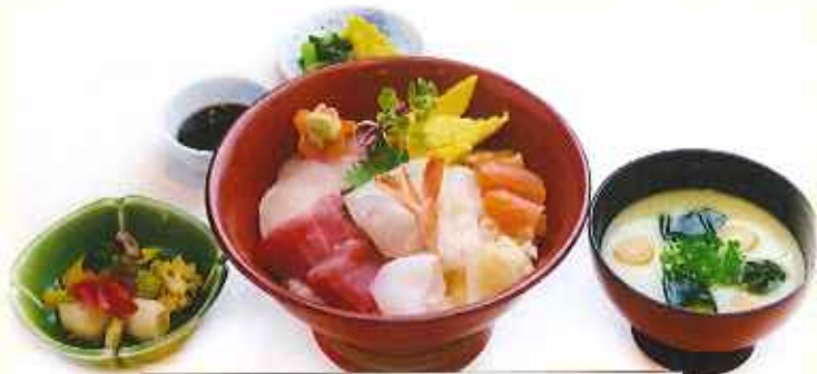
彩り海鮮丼 1,500円(税込)