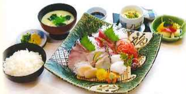
本日のお刺身御膳 1,600円(税込)