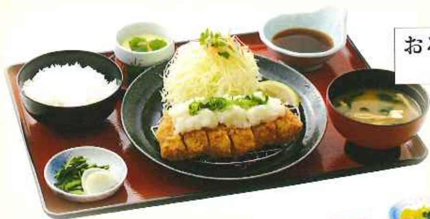
おろしローズかつ膳 1,580円(税込)