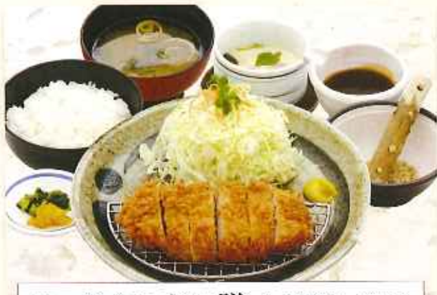
ローズとんかつ膳 1,380円(税込)