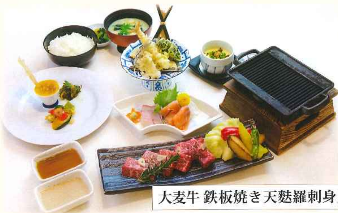
大麦牛 鉄板焼き天麩羅刺身膳 2,800円(税込)