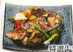
特選牛ロースステーキ