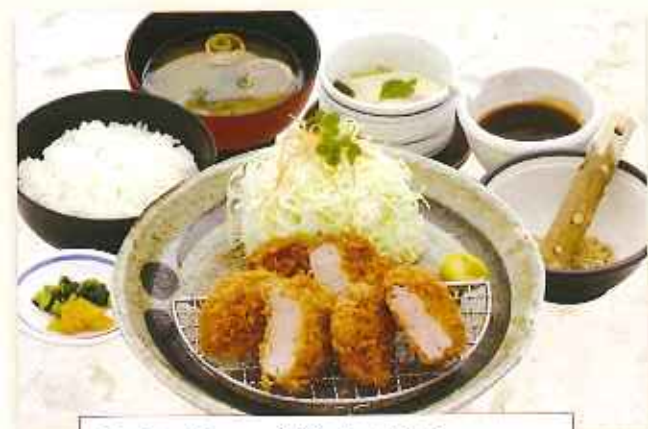
ヒレかつ膳 1,480円(税込)