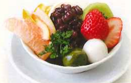
フルーツクリームあんみつ 780円(税込)