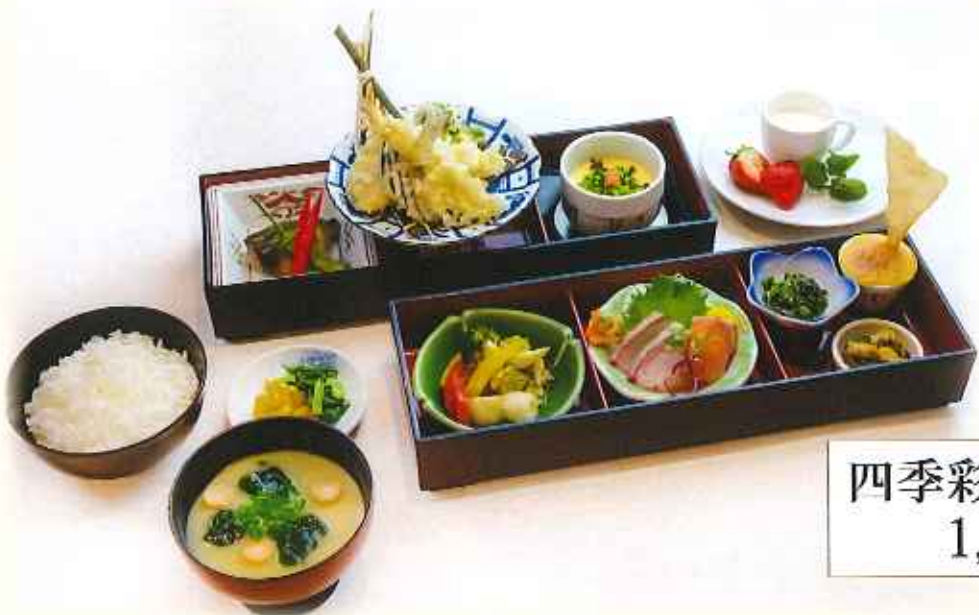
四季彩和懐石膳 1,680円(税込)